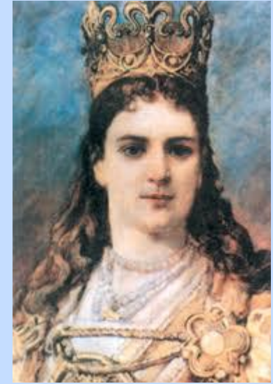
Польская королева Ядвига

Брачный союз скрепил Унию (договор) между Польшей и Литвой