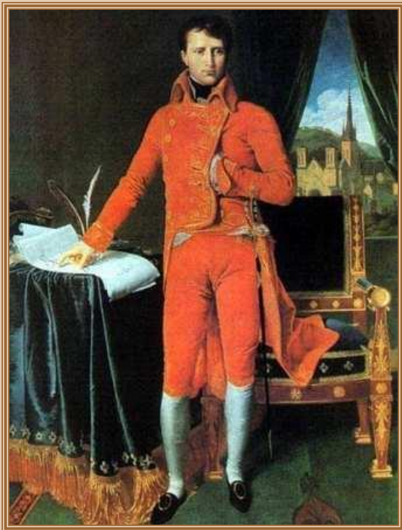
Энгр (Ingres) Жан Огюст Доминик «Портрет Бонапарта» 1804