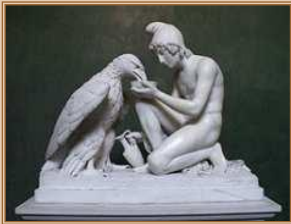
Бертель Торвальдсен. «Ганимед, кормящий Зевесова орла» (1817).

Толчком к развитию классицистической скульптуры в середине XVIII века послужили сочинения Винкельмана и археологические раскопки древних городов, расширившие познания современников об античном ваянии. На грани барокко и классицизма колебались во Франции такие скульпторы, как Пигаль и Гудон. Своего наивысшего воплощения в области пластики классицизм достиг в героических и идиллических работах Антонио Кановы.