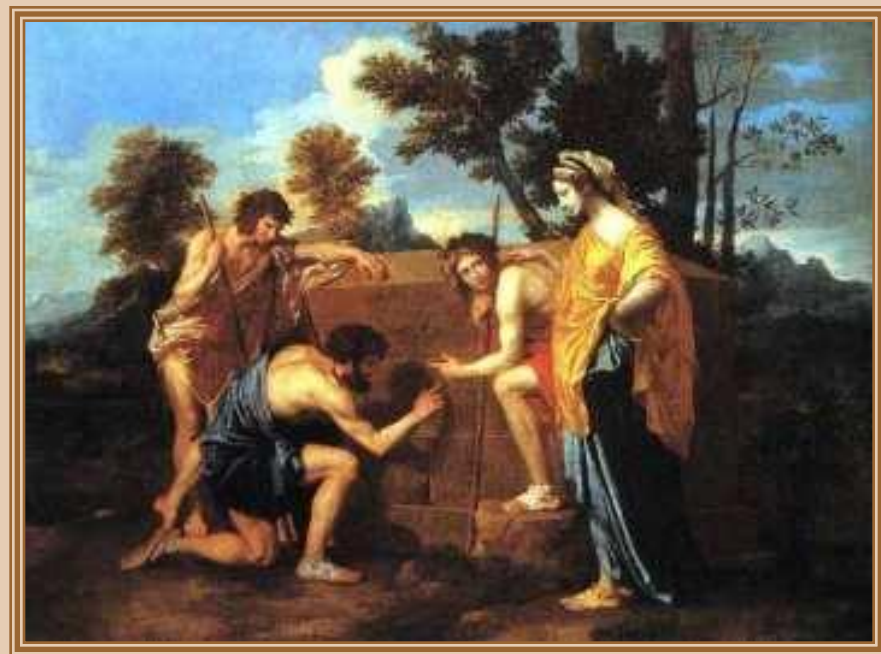
Николо Пуссен "Пастухи в Аркадии" 1638-1640