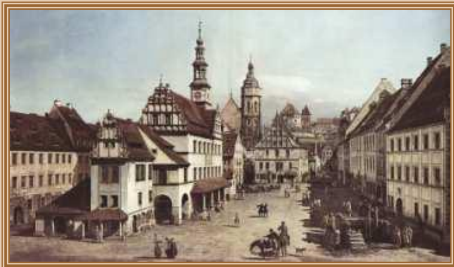
Каналетто Джованни Антонио Площадь в Пирне 1754