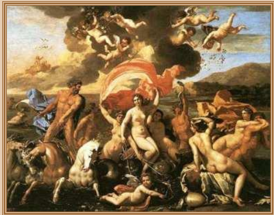
Николо Пуссен "Триумф Нептуна» 1634, Музей искусств, Филадельфия