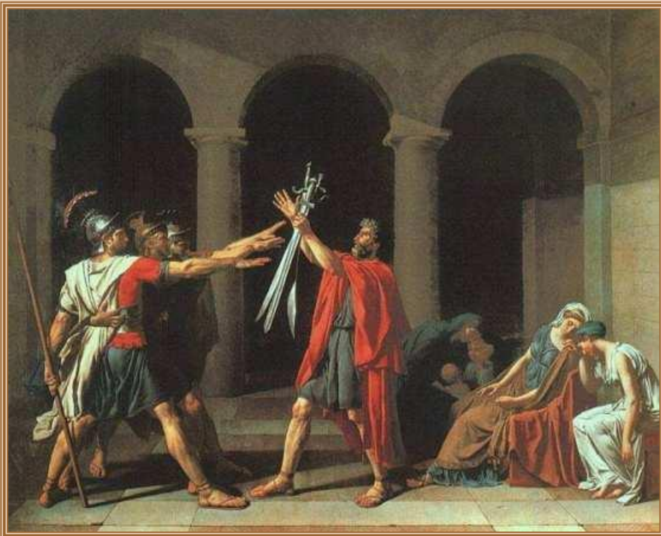
Давид (David) Жак Луи «Клятва Горацев» 1784, Лувр, Париж