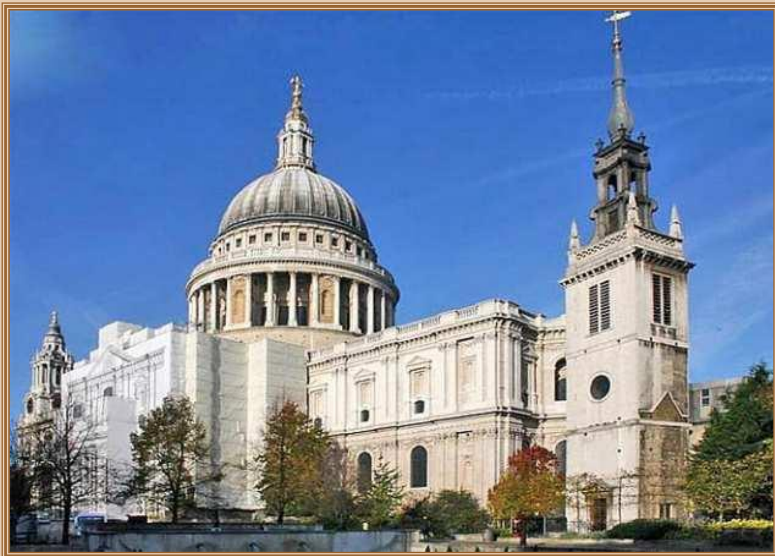
Собор св. Павла К.Рен, 1675-1717 Англия, Лондон