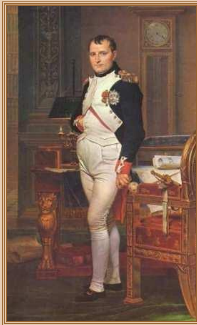
Давид (David) Жак Луи «Портрет Наполеона I» 1817