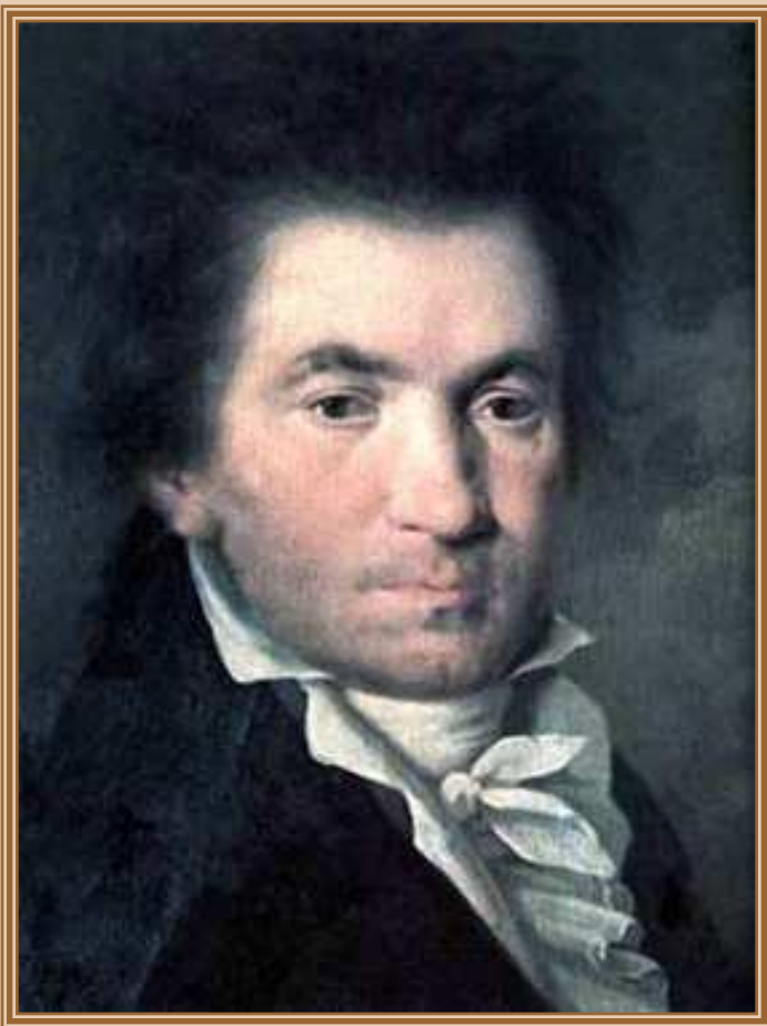
Людвиг ван Бетховен (1770-1827) - немецкий композитор, пианист, дирижёр.