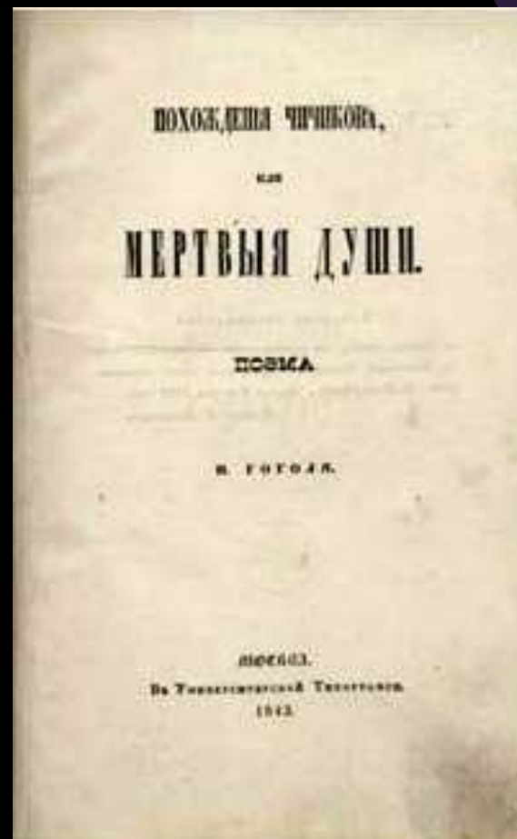
Титульная страница первого издания

Вершиной творчества Н.В. Гоголя стала поэма «Мертвые души». Сюжет «Мертвых душ», как и «Ревизора», был подсказан Гоголю Пушкиным. Это эпическое произведение Николай Васильевич закончил в 1840 году, но лишь спустя два года удалось его напечатать. Цензурный комитет дал такое разрешение лишь с условием внесения значительных поправок.