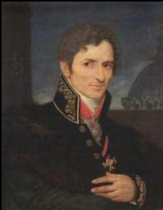
Автор проекта А. Н. Воронихин

Непростую задачу должен был решить архитектор, которому, по замыслу Павла I, предстояло возвести новый храм — Казанский собор . Император желал, чтобы этот храм напоминал собор святого Петра в Риме, величайший собор католического мира. Спустя годы Казанский собор стал мемориалом Отечественной войны 1812-го года. Его иконостас был отделан серебром, которое казаки отбили у французов, пытавшихся увезти сокровища из России, здесь же поместили военные трофеи — знамена и штандарты, ключи от крепостей. В пределах собора похоронили М.И. Кутузова.