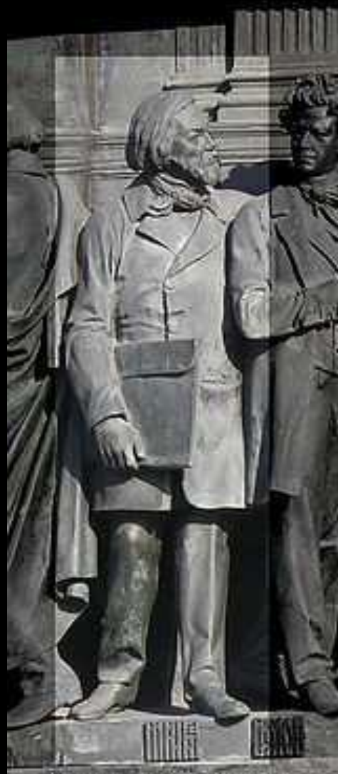
М. И. Глинка на Памятнике «1000-летие России» в Великом Новгороде

В 1802 г. в России создается Филармоническое общество. В его залах выступали с концертами знаменитые музыканты, среди которых Ф. Лист, Г. Берлиоз, П. Виардо. В сезон общество давало несколько больших концертов, знакомило публику с новинками, именно здесь впервые в России прозвучали произведения Генделя, Гайдна, Моцарта, Бетховена. Основателем русской школы в музыке стал М.И. Глинка. «Жизнь за царя», «Руслан и Людмила» положили начало двум направлениям русского оперного искусства — народной музыкальной драме и опере-сказке.