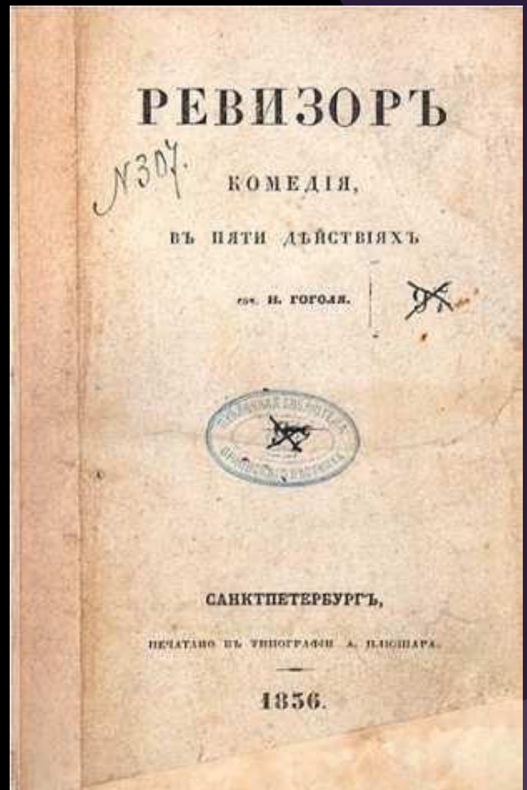
Обложка первого издания «Ревизора»

Высшее общество восприняло «Ревизор» как грубую карикатуру, как злую насмешку над русской провинцией.