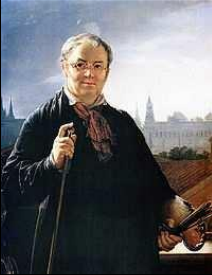
Автопортрет с кистями и палитрой на фоне окна с видом на Кремль (1844)

Образы простых людей привлекали художника В.А. Тропинина, который до 47 лет находился в крепостной зависимости. Тропининские портреты отличало особое идиллическое мировидение, их герои бесконфликтны и гармоничны.