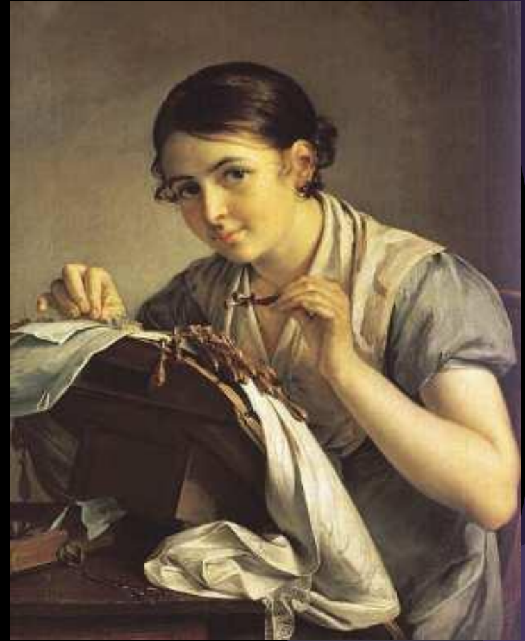
"Кружевница" 1823 (Третьяковская галерея, Москва)