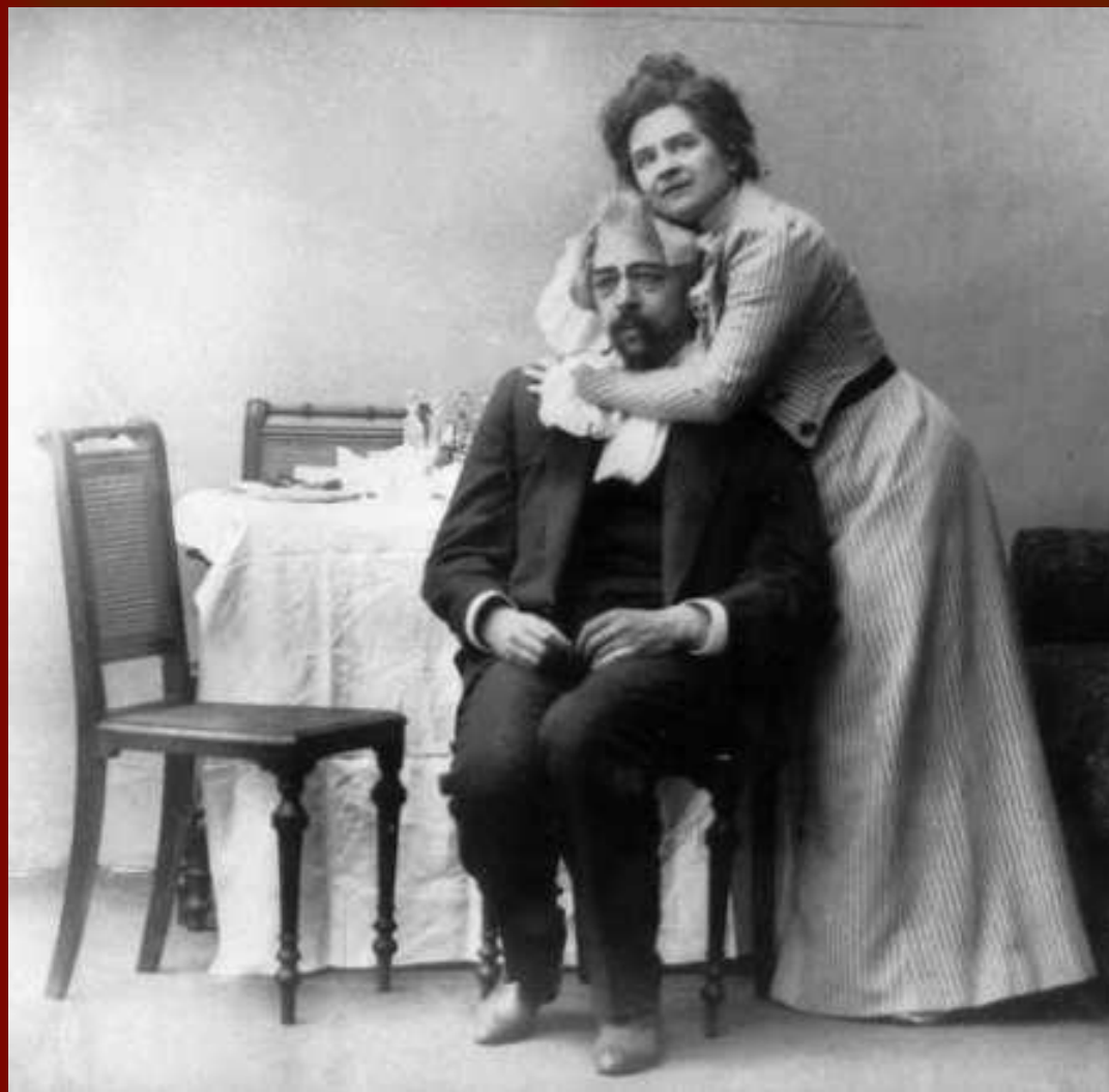
1899 год. Сцена из спектакля "Чайка", поставленном в МХТ. В роли Аркадиной - Ольга Книппер, в роли Тригорина - Константин Станиславский