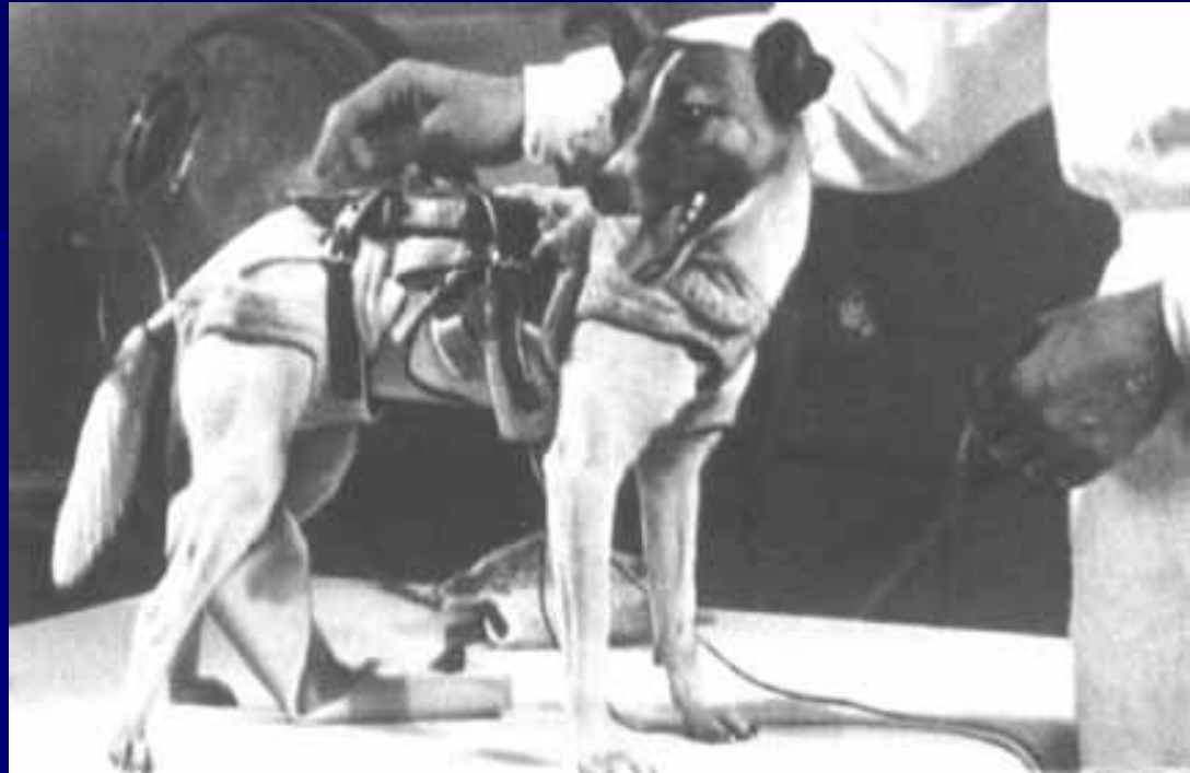
Биокосмонавт Лайка перед полетом в космос.

Животных для нужд космонавтики стали использовать очень рано. Уже на втором советском спутнике, запущенном 3 ноября 1957 года, находилось живое существо – собака Лайка. В то время люди ещё очень мало знали о космосе, а космические аппараты ещё не умели возвращать с орбиты. Поэтому Лайка навсегда осталась в космическом пространстве.