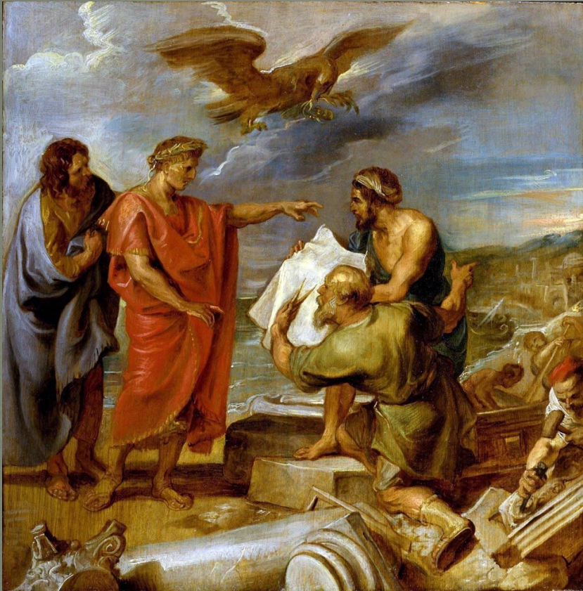
П. Рубенс. Основание Константинополя.

Причины перенесения столицы в Византий (Константинополь):