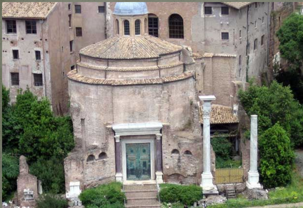
Христианская церковь на форуме Веспасиана, Рим.