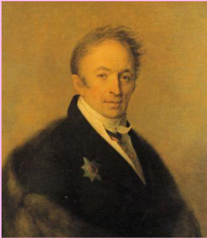
Н.М.Карамзин. Худ. А.Г. Венецианов. 1828