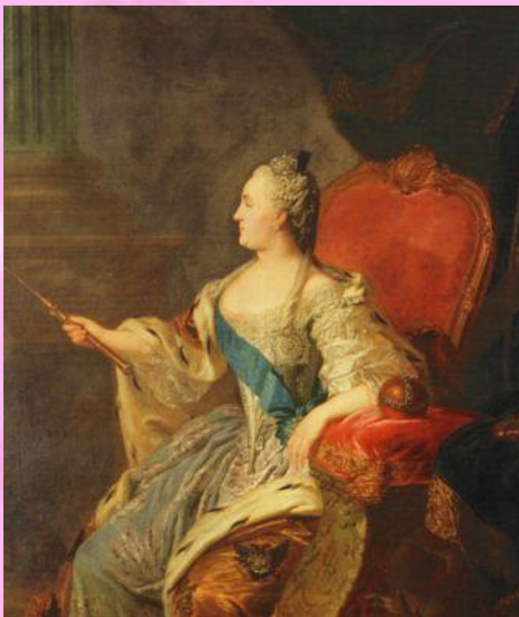
Ф.С.Рокотов. Портрет Екатерины II.