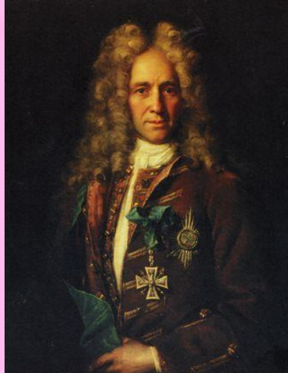
Портрет канцлера графа Г.И.Головкина