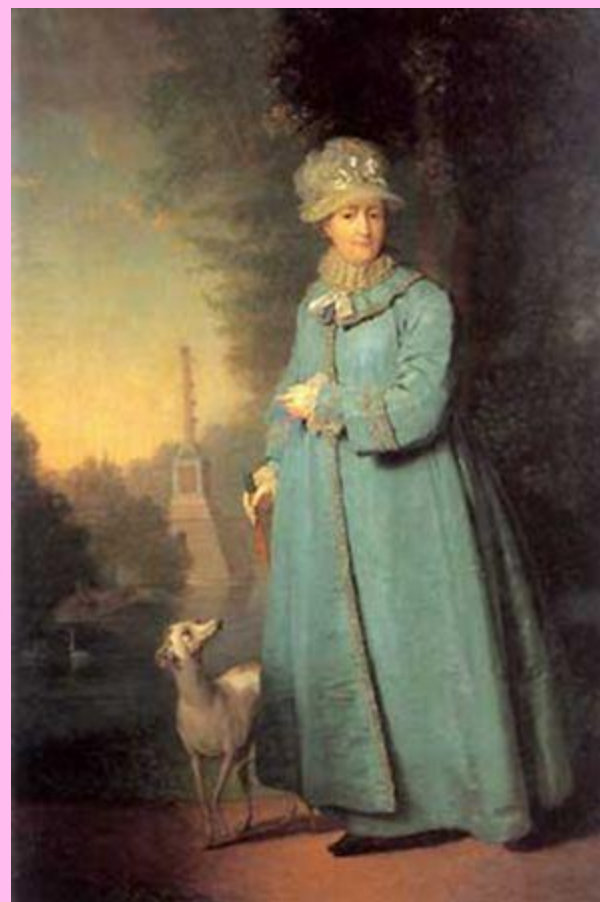
В.Боровиковский. Екатерина II.