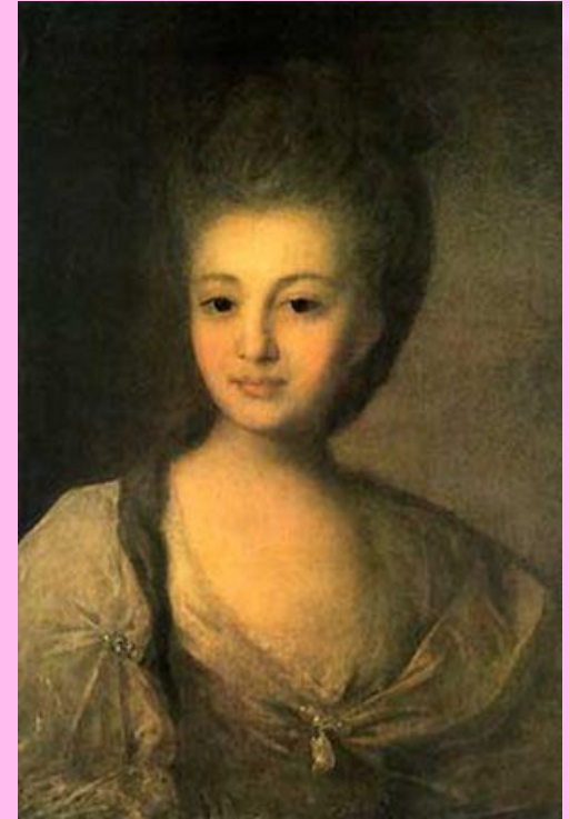
Портрет А.П. Струйской