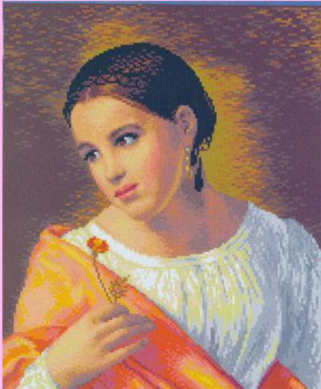
О.Кипренский. Бедная Лиза.