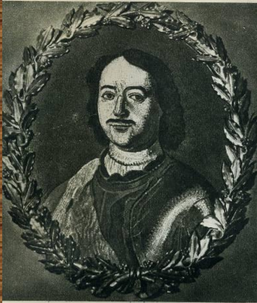
Петр I. Мозаика работы М. Ломоносова.

Возродил древнее искусство мозаики (со своими учениками создал более 40 мозаичных картин).