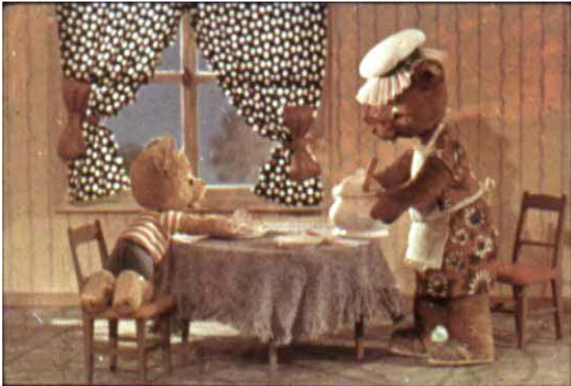
А Рикики тут же хватает со стола бутерброд.