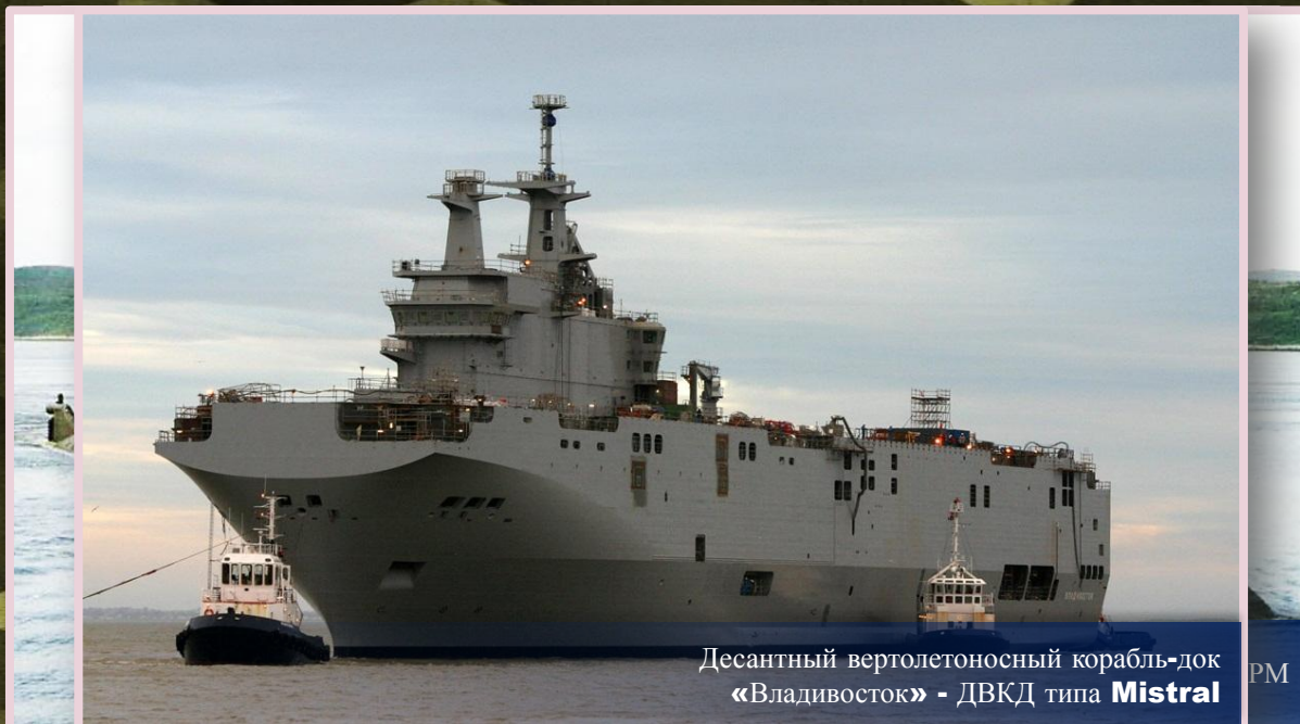
Десантный вертолетоносный корабль-док «Владивосток» - ДВКД типа Mistral