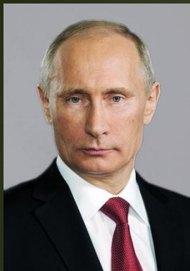
Президент РФ, Верховный главнокомандующий ВС РФ В.В. Путин