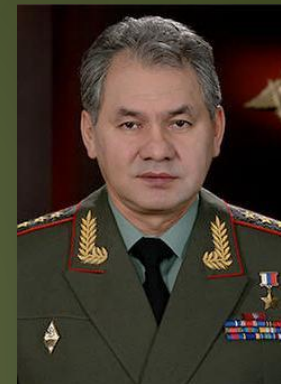
Министр обороны РФ, генерал армии С.К. Шойгу