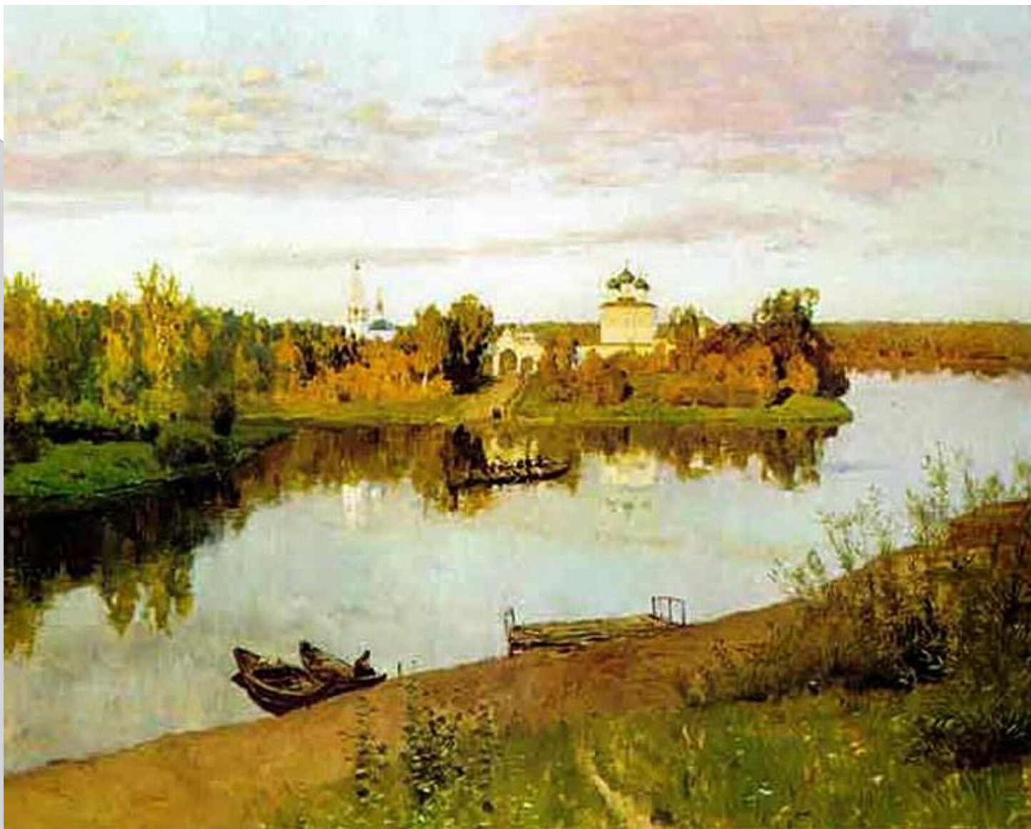
И.И.Левитан «Вечерний звон»