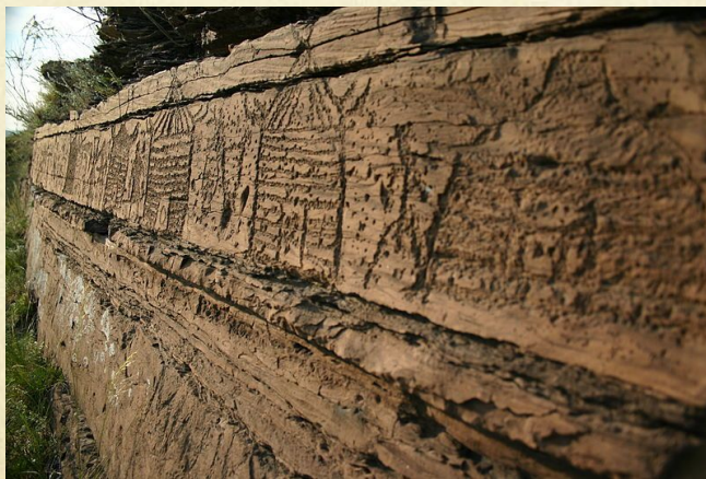
Малая Боярская писаница