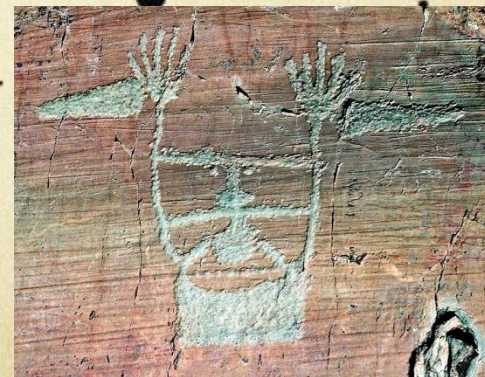
Долина чудес (Франция)