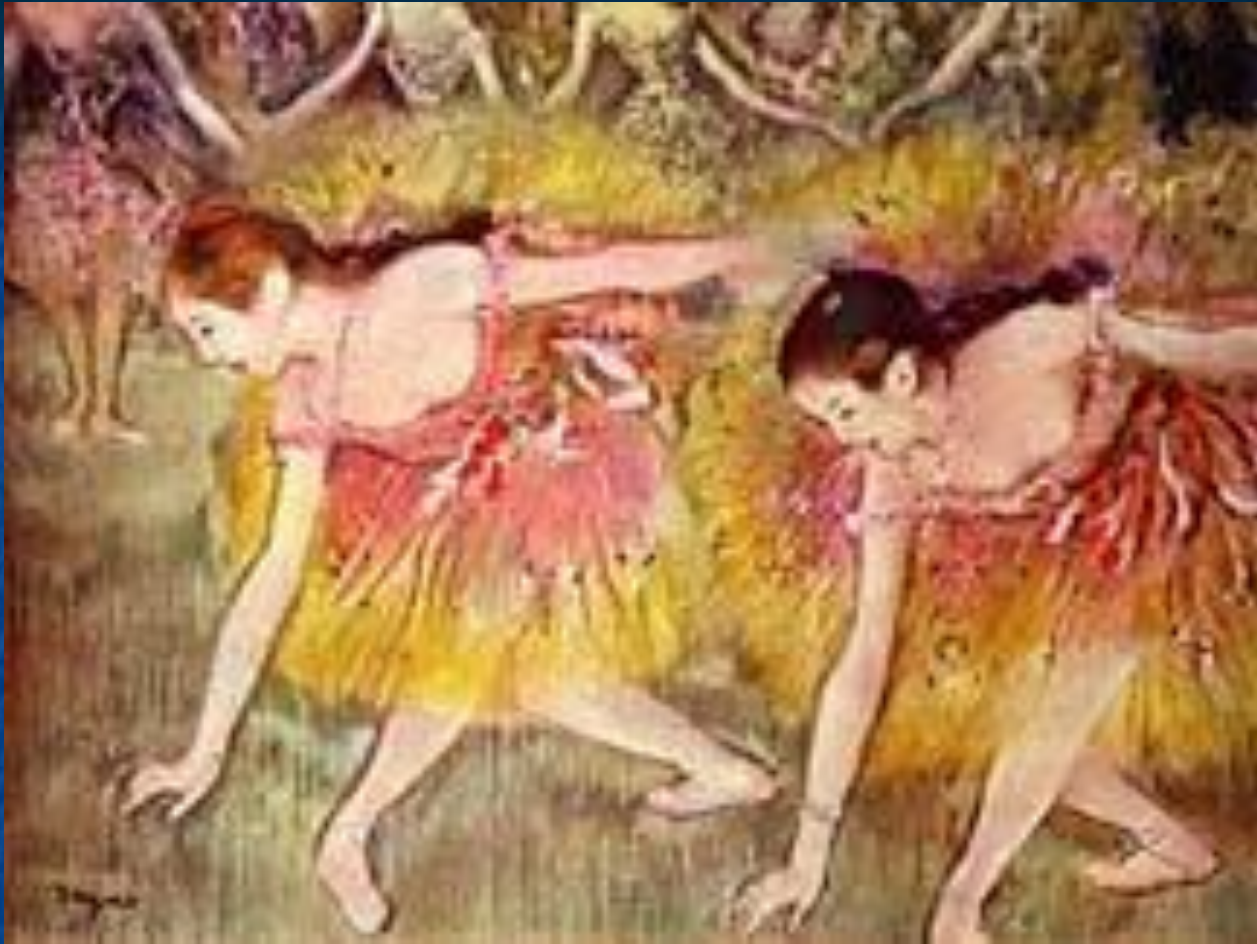
Танцовщицы на поклонах