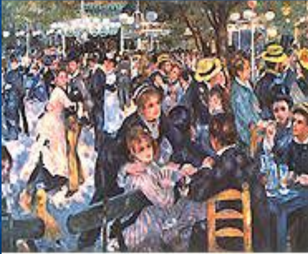
«Бал в Мулен де ла Галет». 1876.