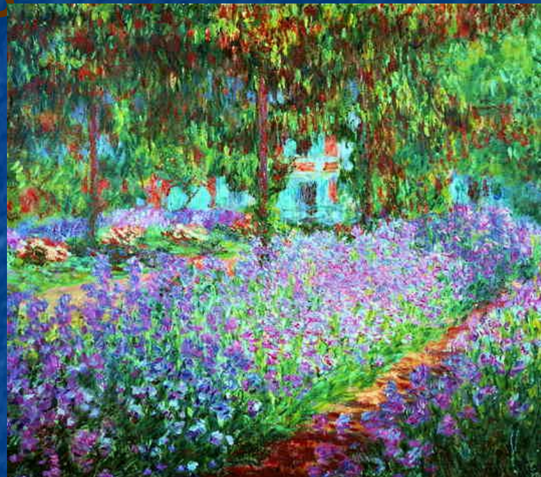
«Сад художника в Живерни»

Она представляла собой не гладкое письмо, с помощью тонких лессировок (так пишут ателье живописцев), а состояла из пастозных мазков.