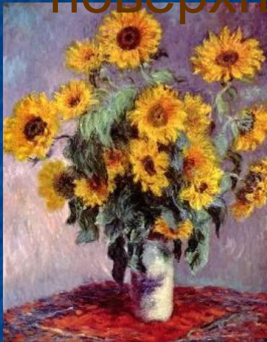
«Натюрморт с подсолнухами»