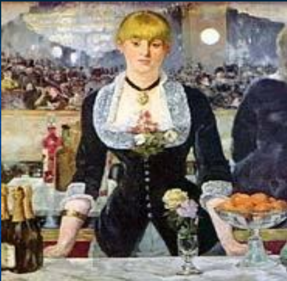
Бар в Фоли-Бержер.