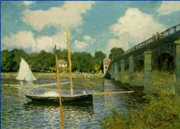
«Регата в Аржантее»

Одержимость Моне светом и цветом вылилась в многолетние исследования и эксперименты, целью которых было зафиксировать на холсте мимолетные, ускользающие оттенки природы.