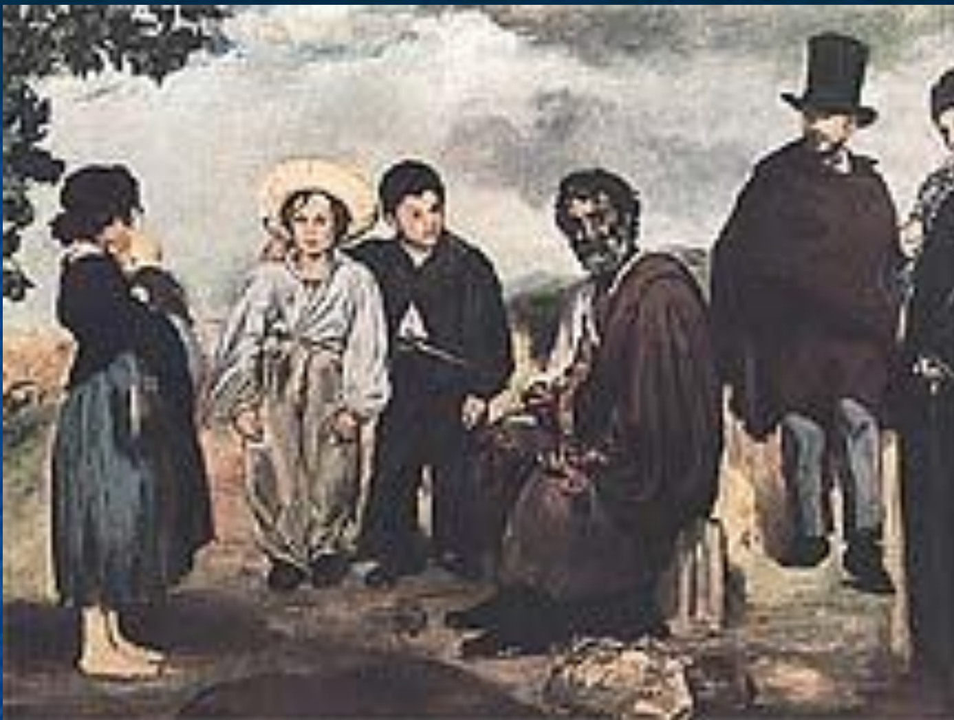
«Старый музыкант». 1862 год.