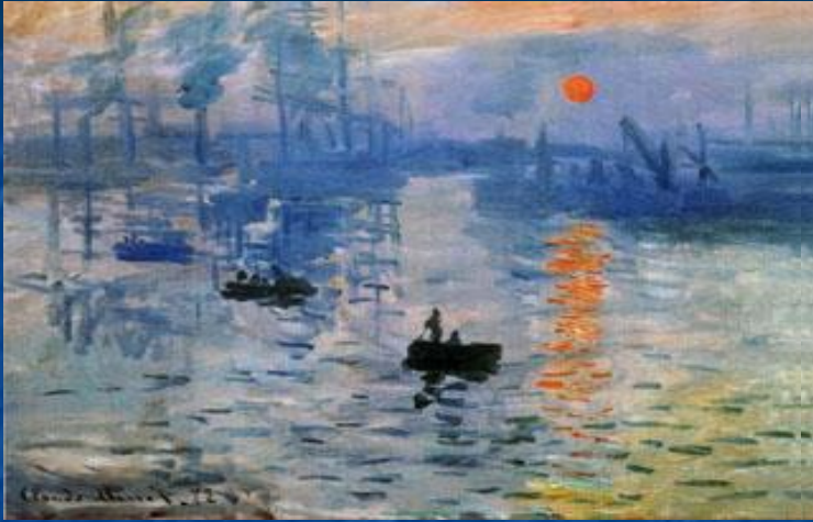
«Впечатления. Восход солнца.»