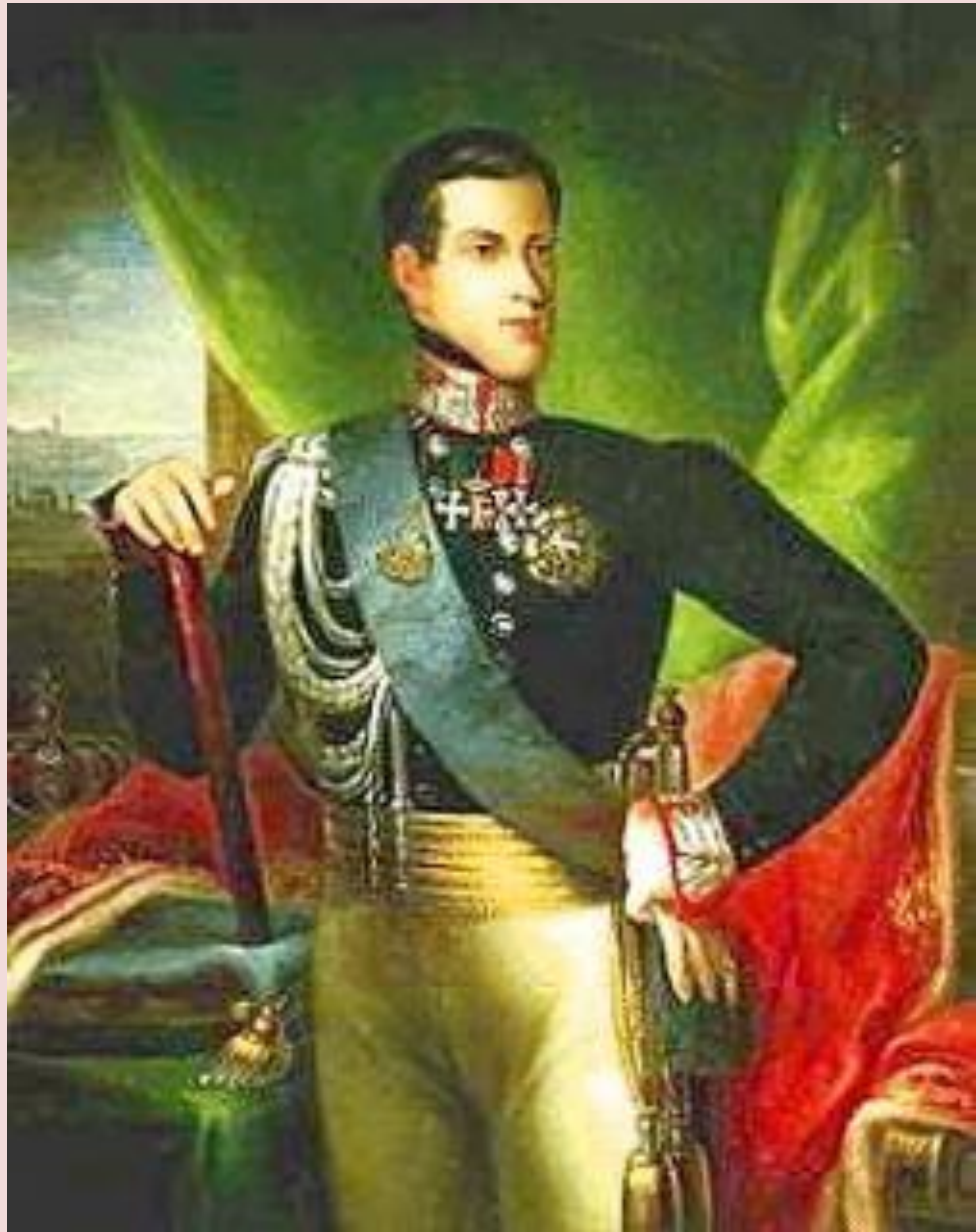
Карл Альберт Савойский.

1849 г. – новая война и снова неудача. Карл Альберт отрекся от престола в пользу сына Виктора Эммануила II, который подписал мирный договор с Австрией.