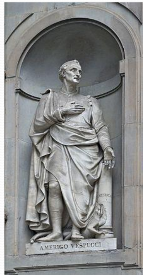
Америго Веспуччи, Флоренция