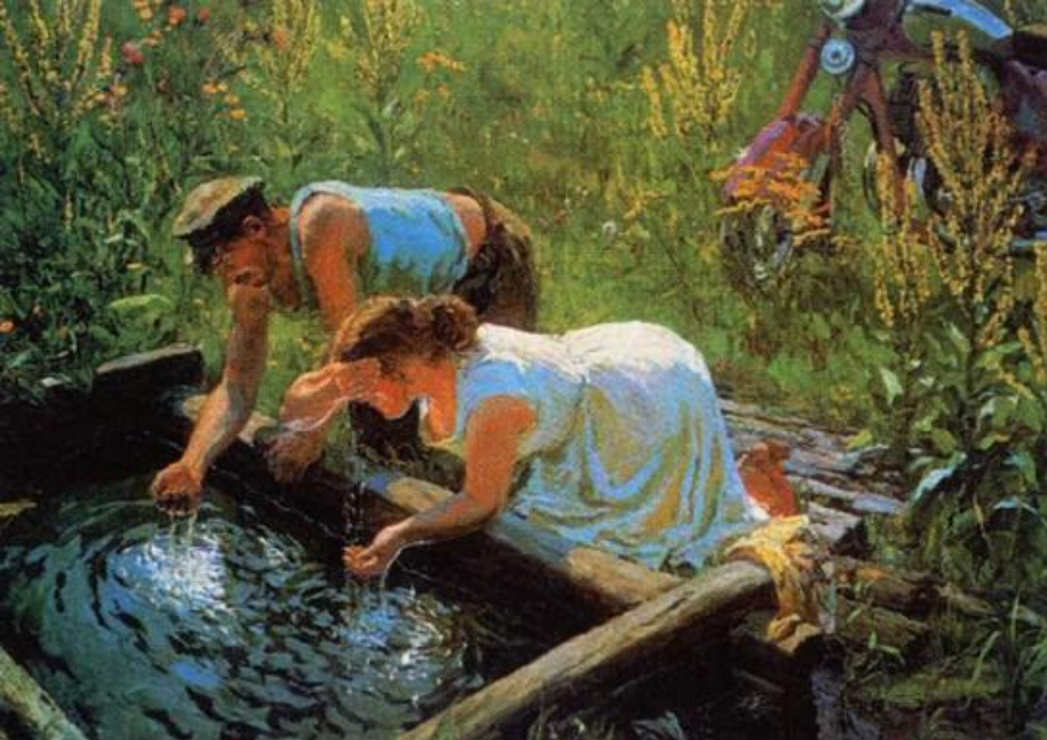
А. Пластов. Полдень

В зависимости от сюжета А.Пластов использует то буйную игру красок, цвета, и тогда всё на полотне залито солнцем, радугой красок, то пишет в сдержанном колорите. Но в любом случае его изображение – сама правда жизни.