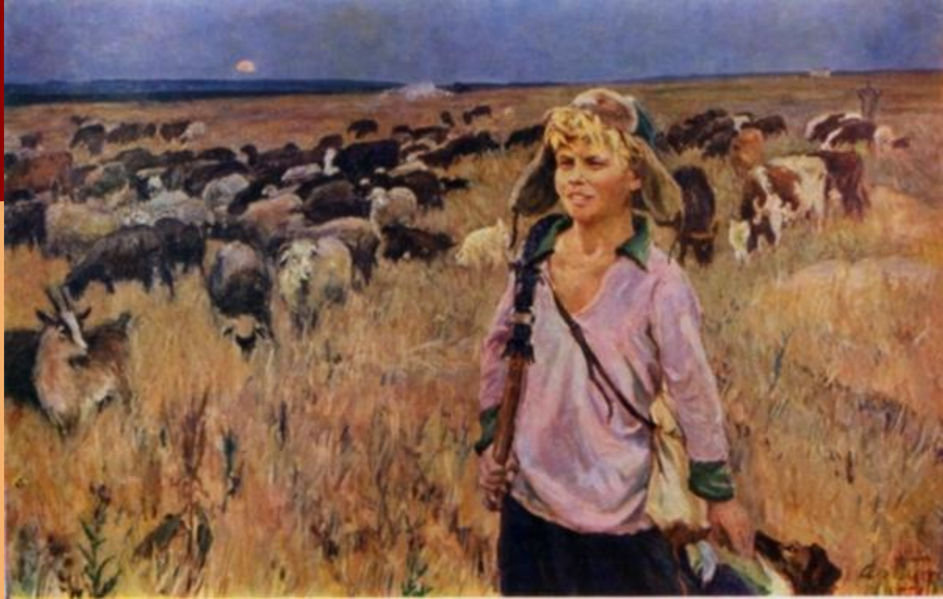
А. Пластов. Витя-подпасок