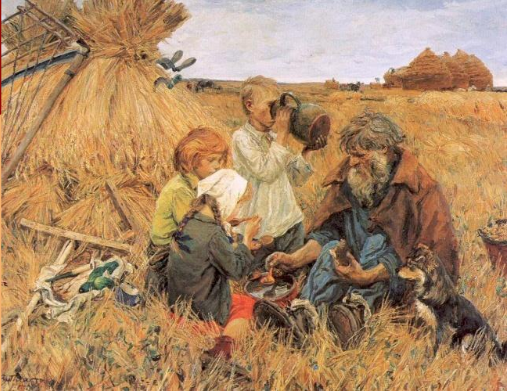
А. Пластов. Жатва