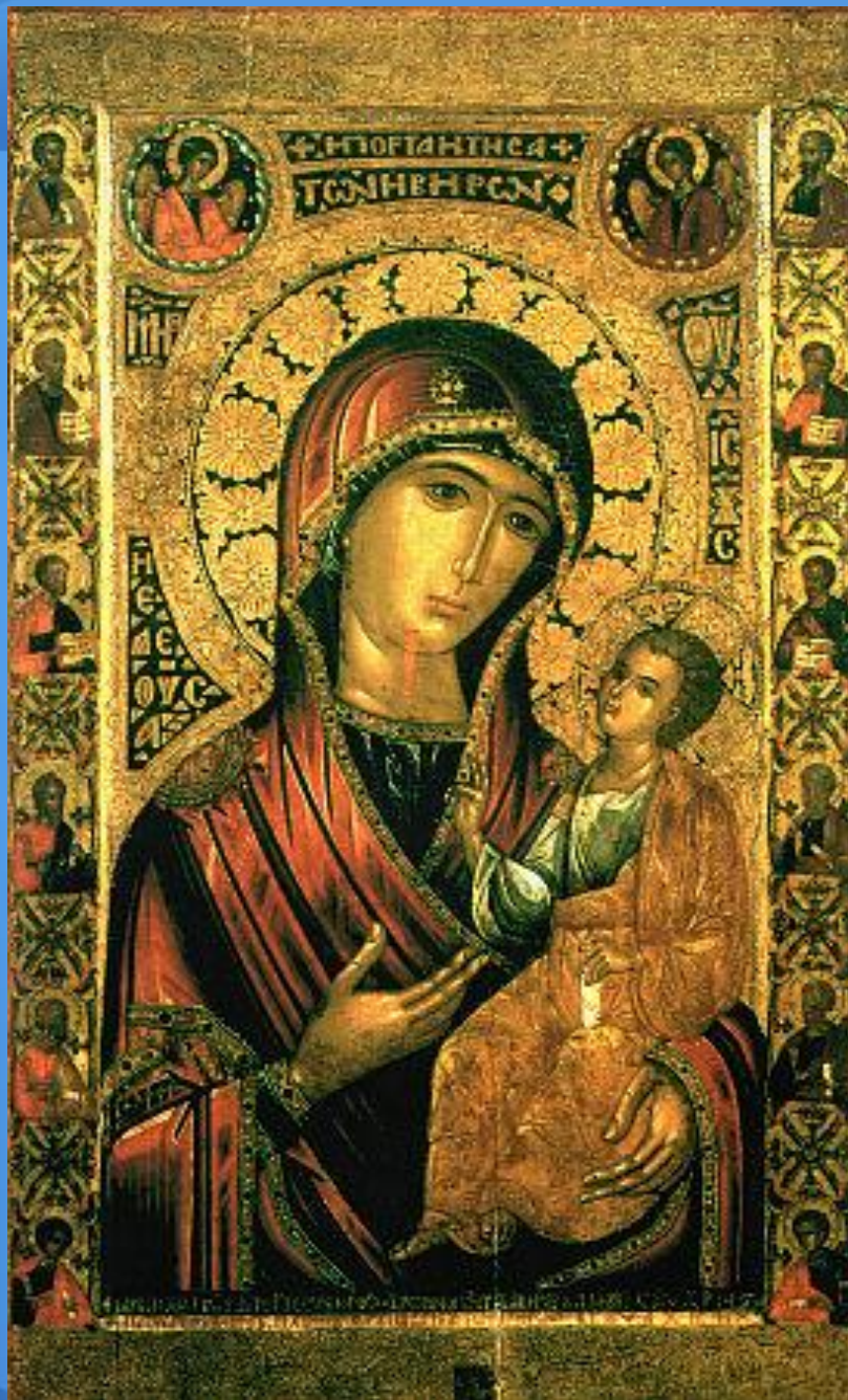
Иверская икона Божией Матери. XIX