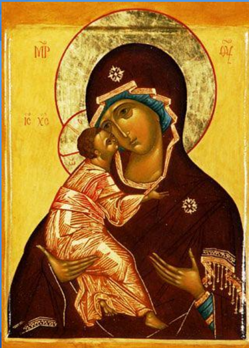
Владимирская икона Божией Матери