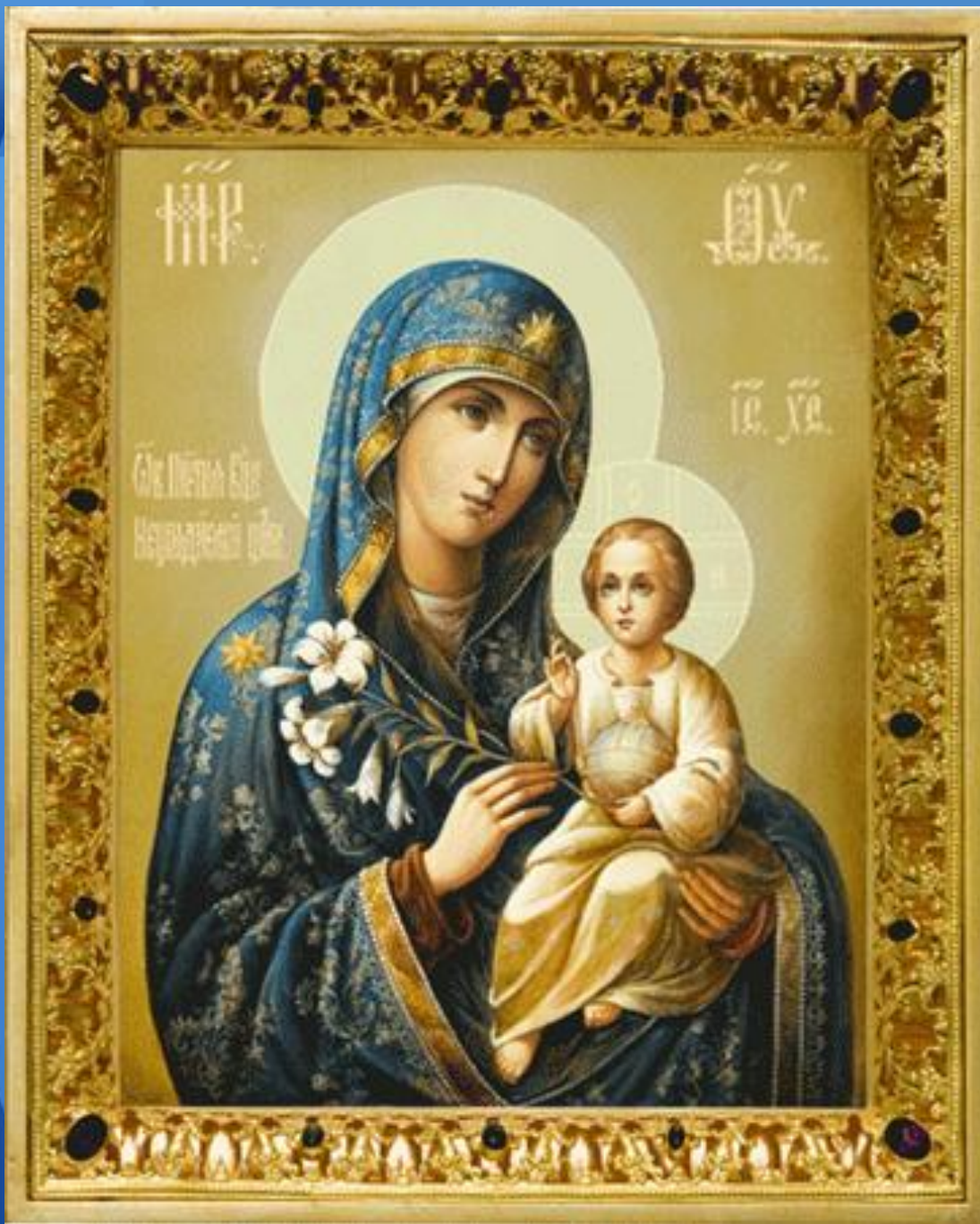
Образ Божией Матери «Неувядаемый цвет»