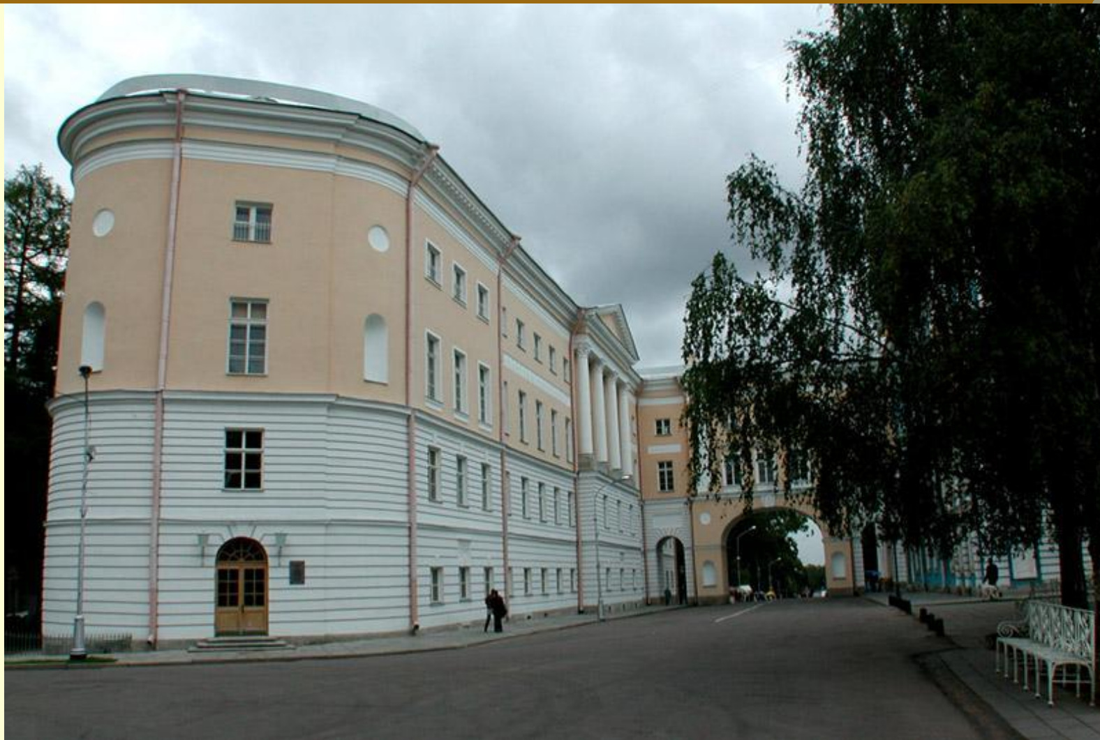
Александровский (Царскосельский) лицей