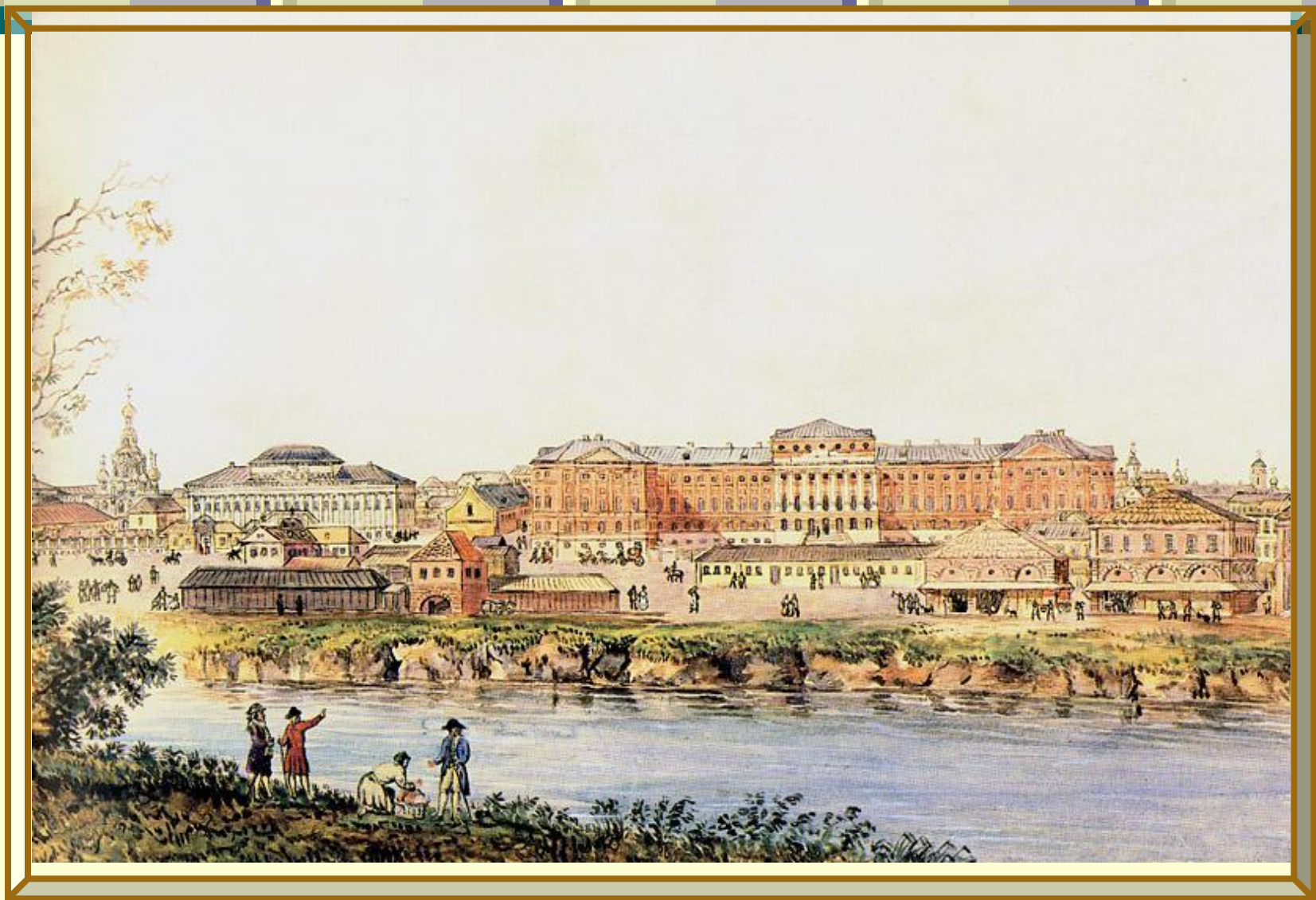
Московский университет, 1790 г.