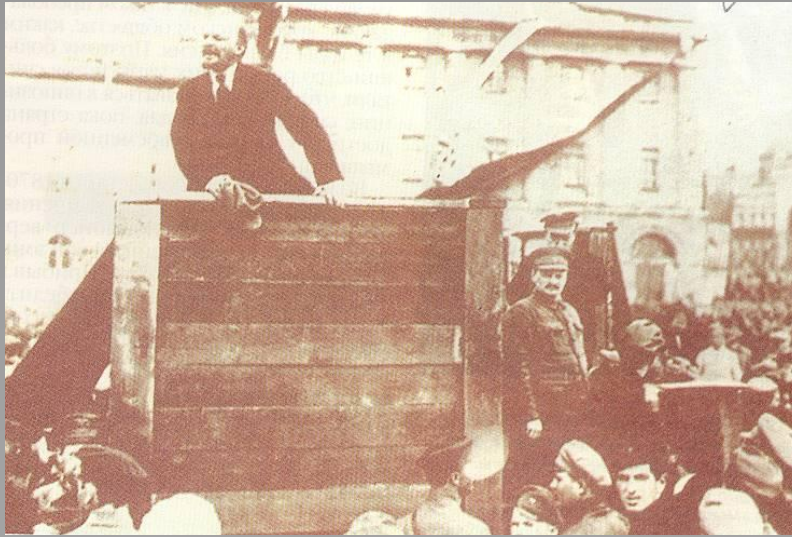
Ленин – вождь большевиков