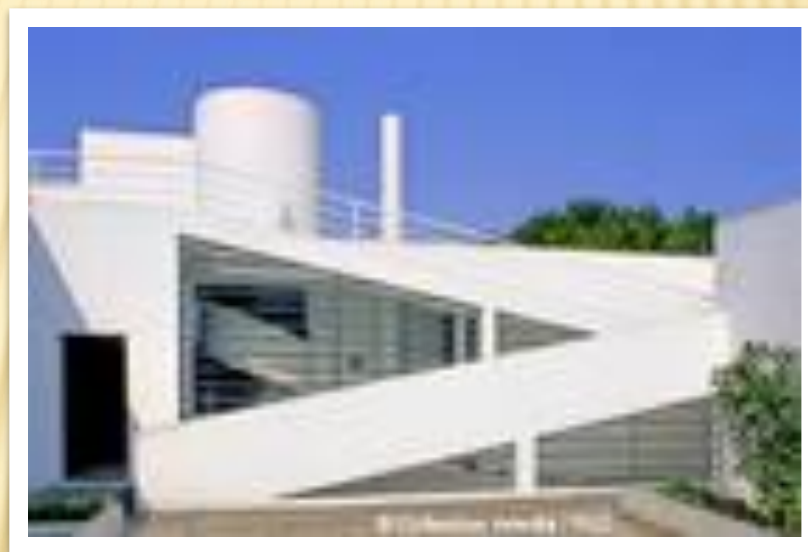
Вилла Савой в Пуасси, 1930, арх. Ле Корбюзье;