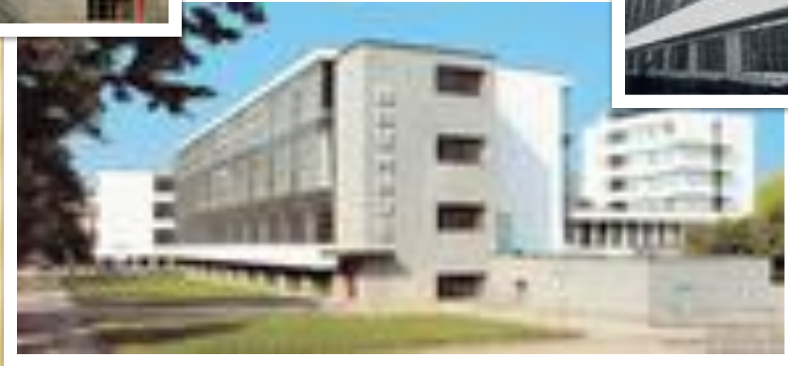
Здание Баухауза в Дессау, арх. В. Гропиус