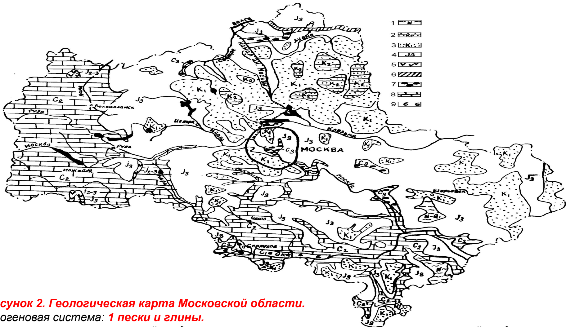
Рисунок 2. Геологическая карта Московской области.