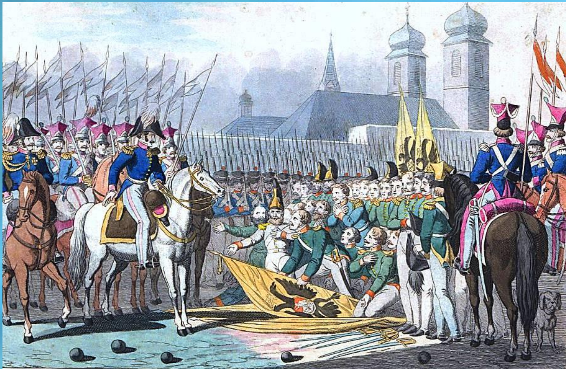
Низложение русских знамён после битвы около Вавра в 1831 году.