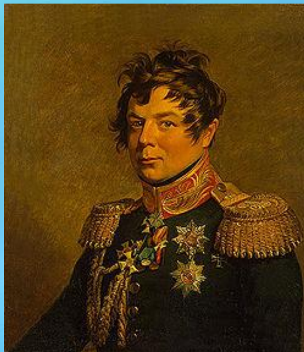
И. Дибич (Забалканский).