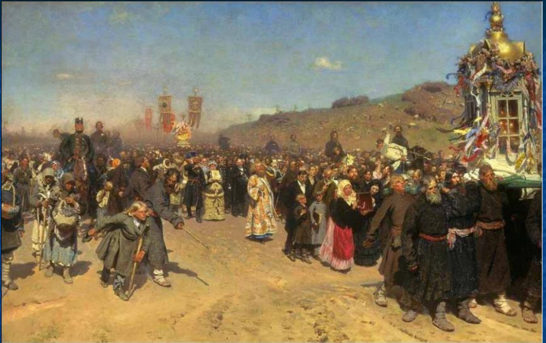
Крестный ход в Курской губернии