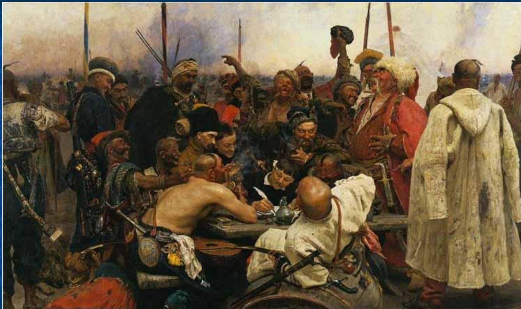
Запорожцы пишут письмо турецкому султану