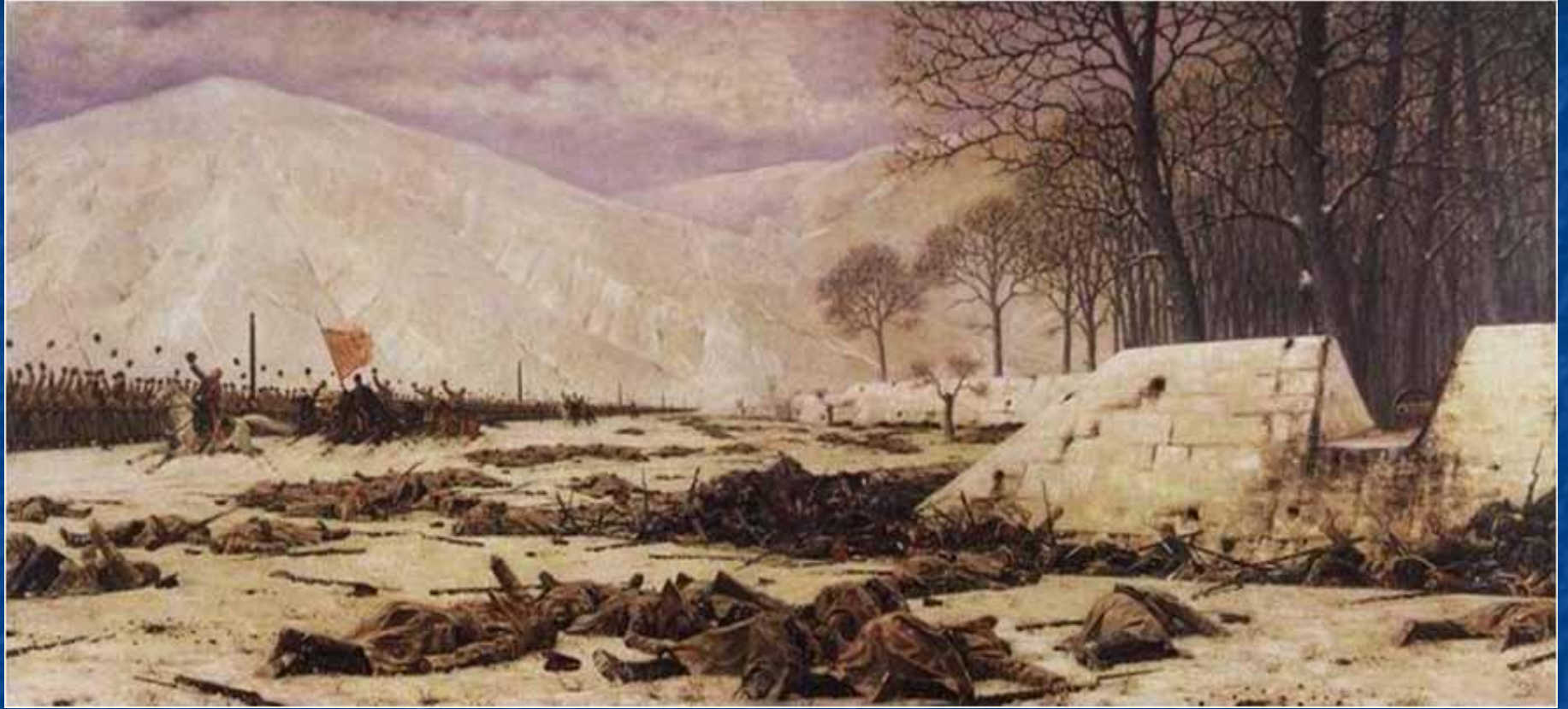
Скобелев под Шипкой