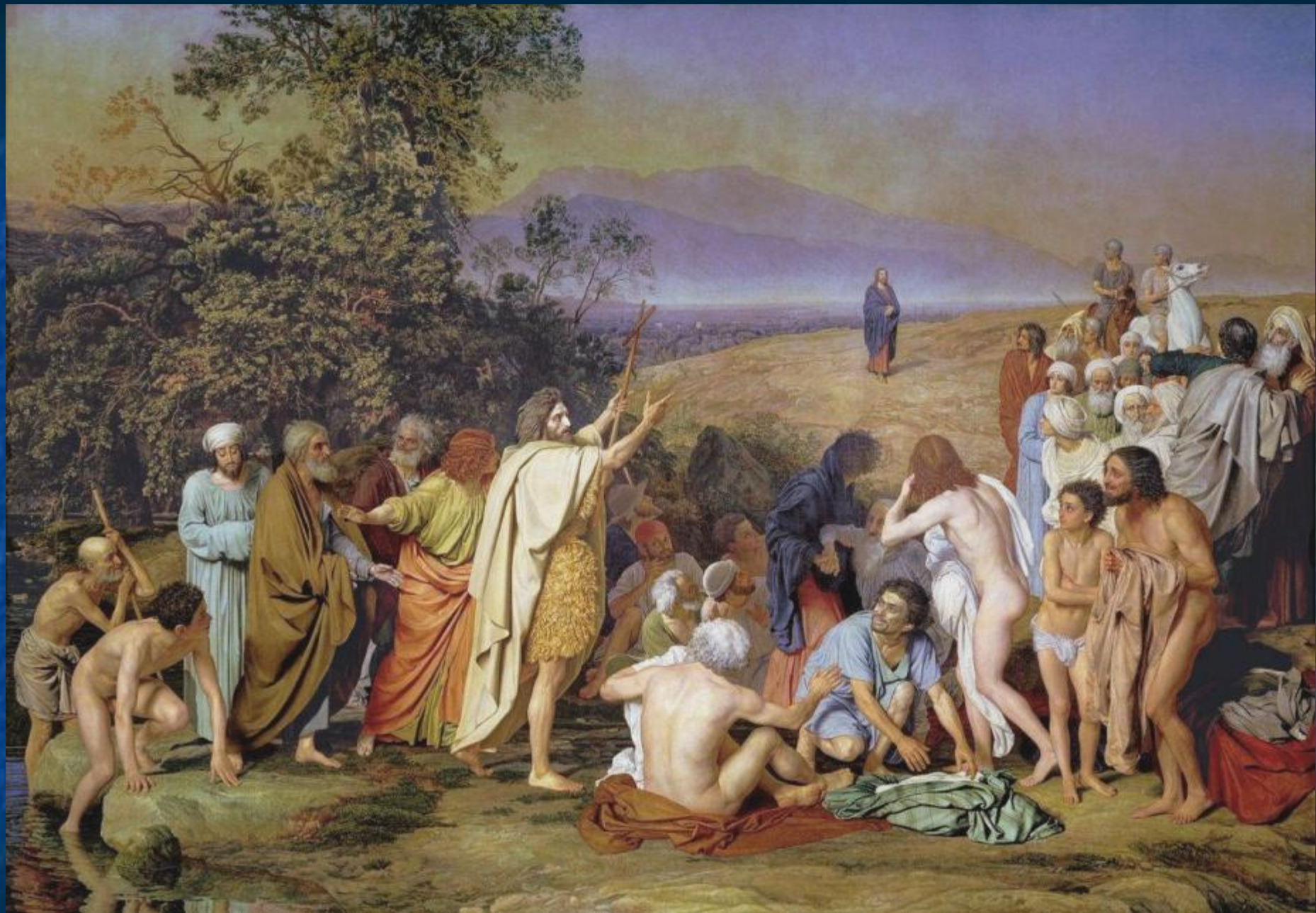
Явление Христа народу (Явление Мессии). 1837-1857.