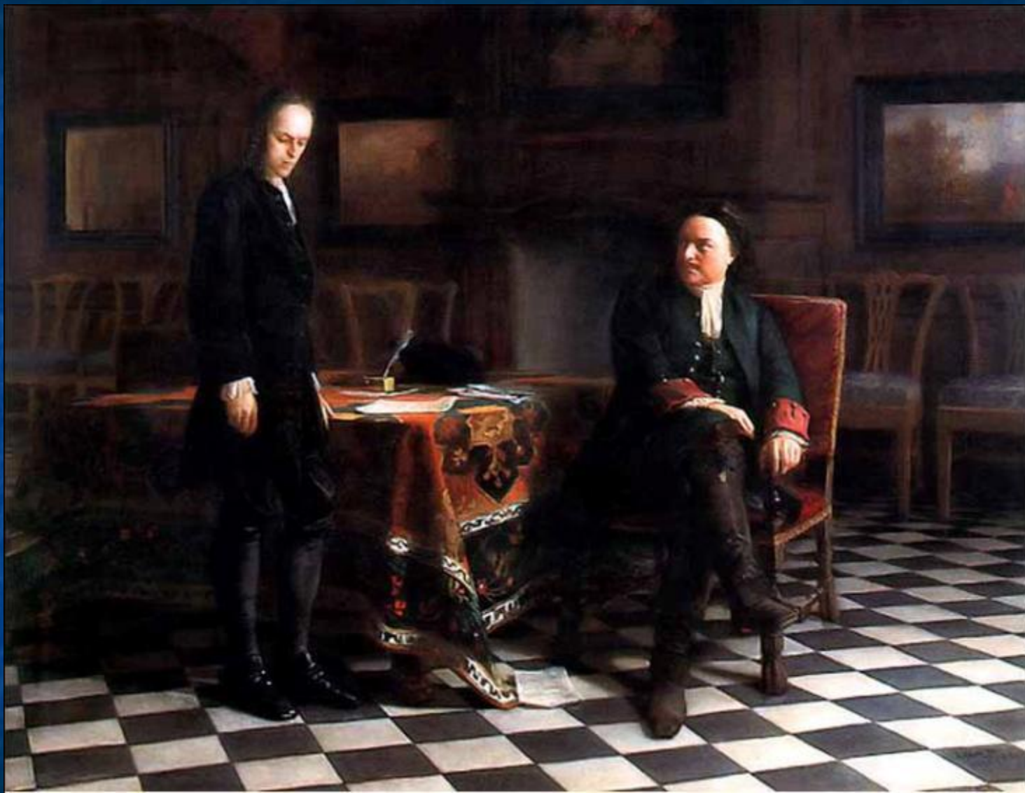
Петр I допрашивает царевича Алексея Петровича в Петергофе