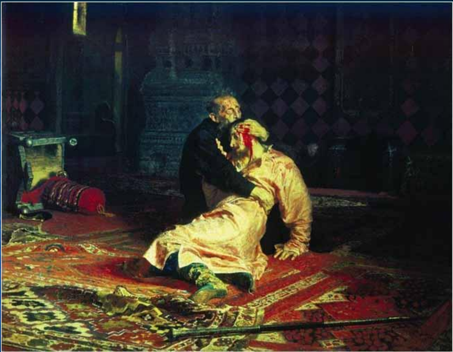
Царь Иван Грозный и сын его Иван