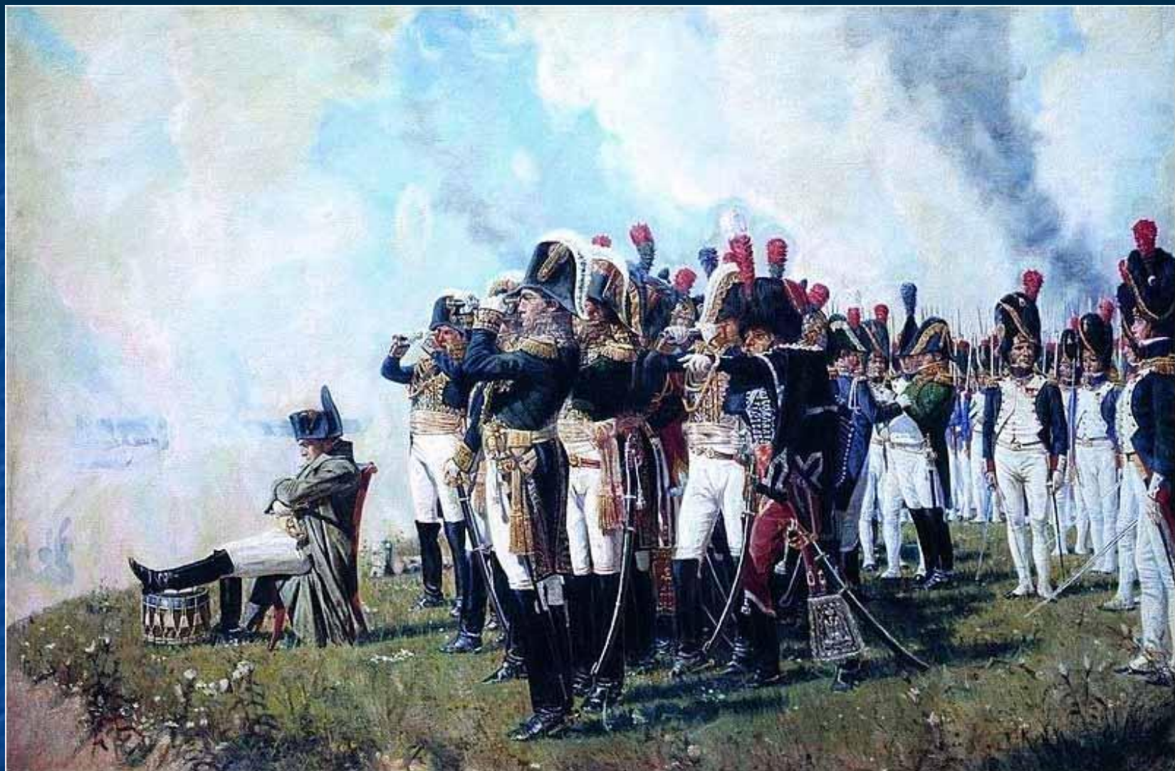
Наполеон на Бородинских высотах