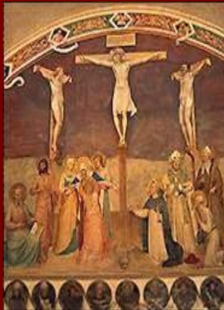
Фреска монастыря Сан – Марко.