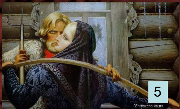
У чужого окна