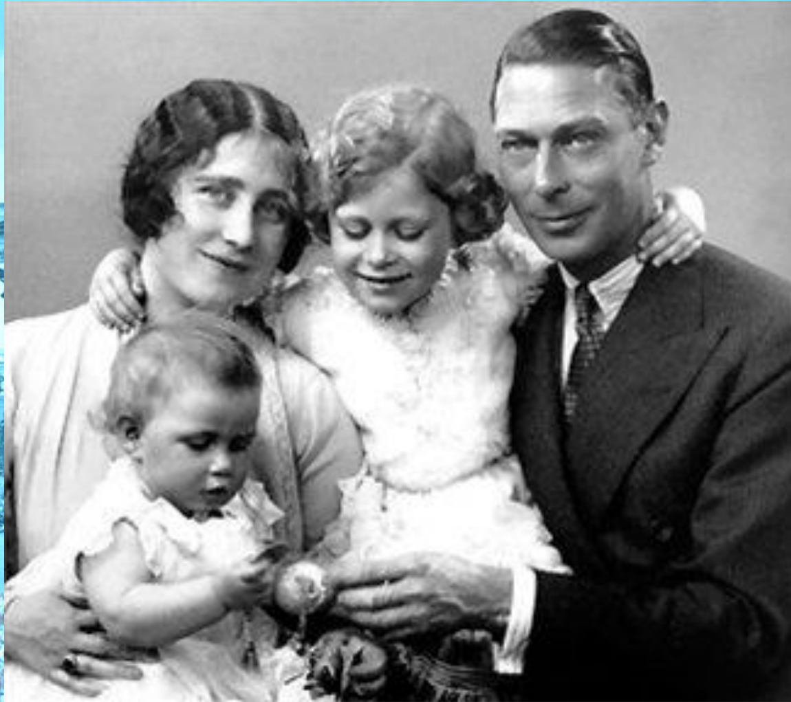
Принц Альберт, леди Елизавета Боуз-Лайон и их дочери Елизавета и Маргарет

Личность Елизаветы II сформировывалась на фоне всеобщей заботы и любви. С раннего детства ее воспитанию и образованию уделялось огромное внимание.