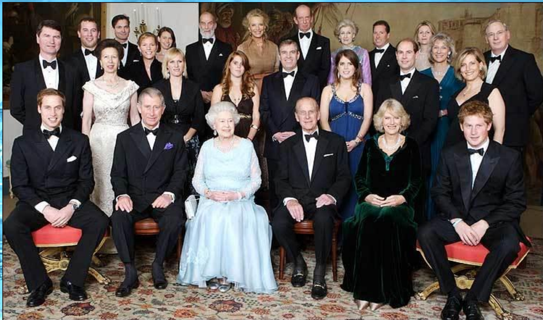
Члены королевской семьи (наши дни)