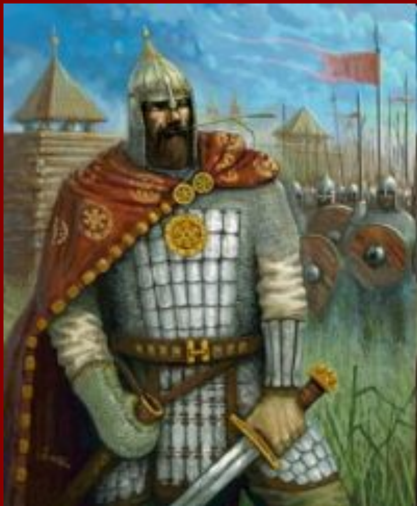
Князь Ярополк Святославич