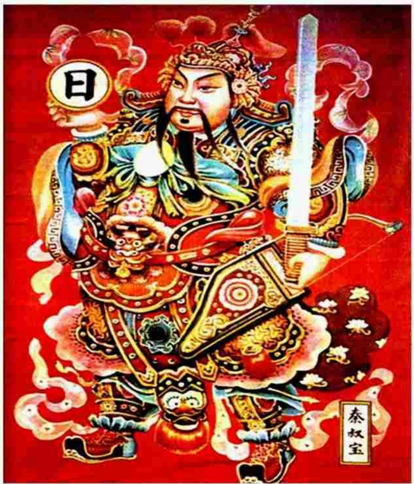
Цинь Шихуан Древнекитайский рисунок

До 3 в. до н.э. в Китае существовало 7 царств.