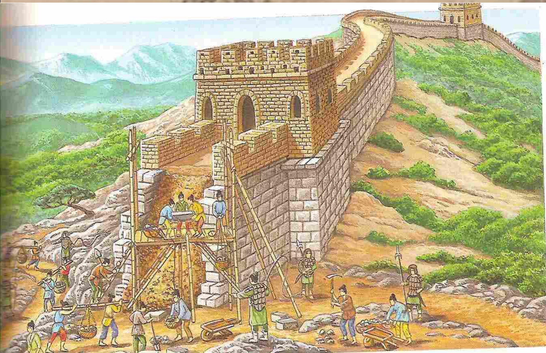
Великая китайская стена