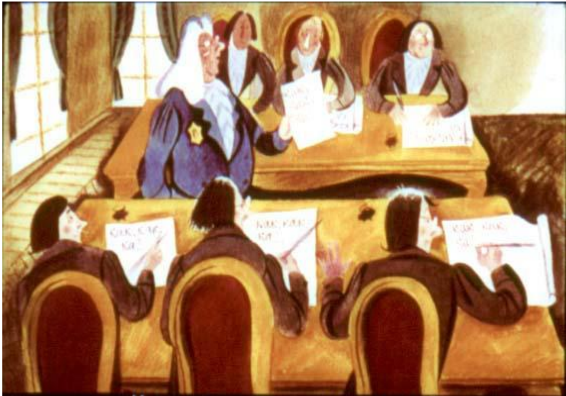
И все писцы написали «как, как, ко?..»