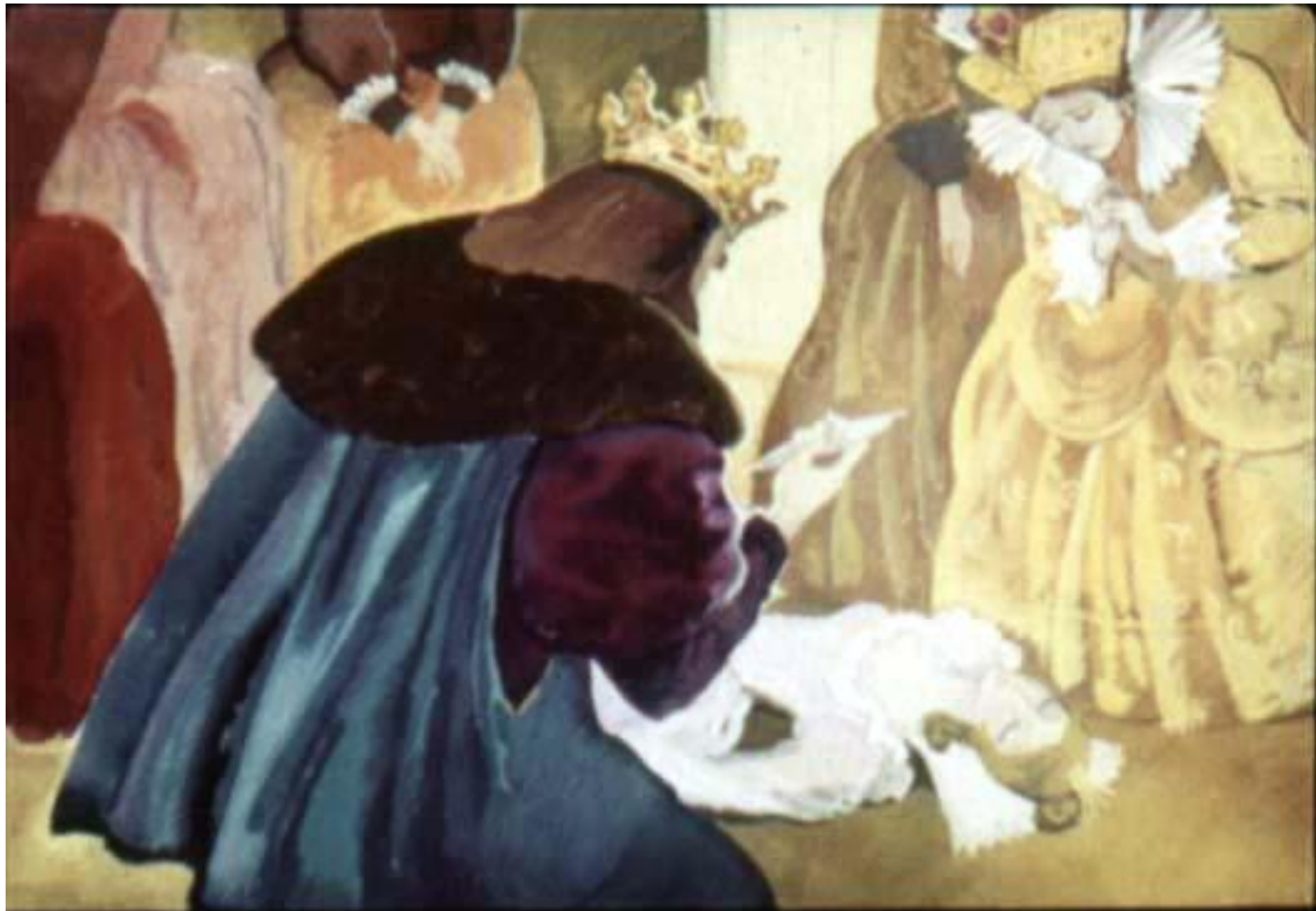
Сбежались придворные, король, королева... [30]