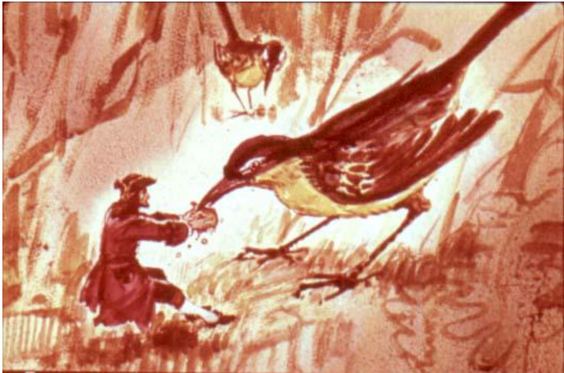
Гулливвер был так мал и беззащитен, что даже самые маленькие птицы не боялись его.