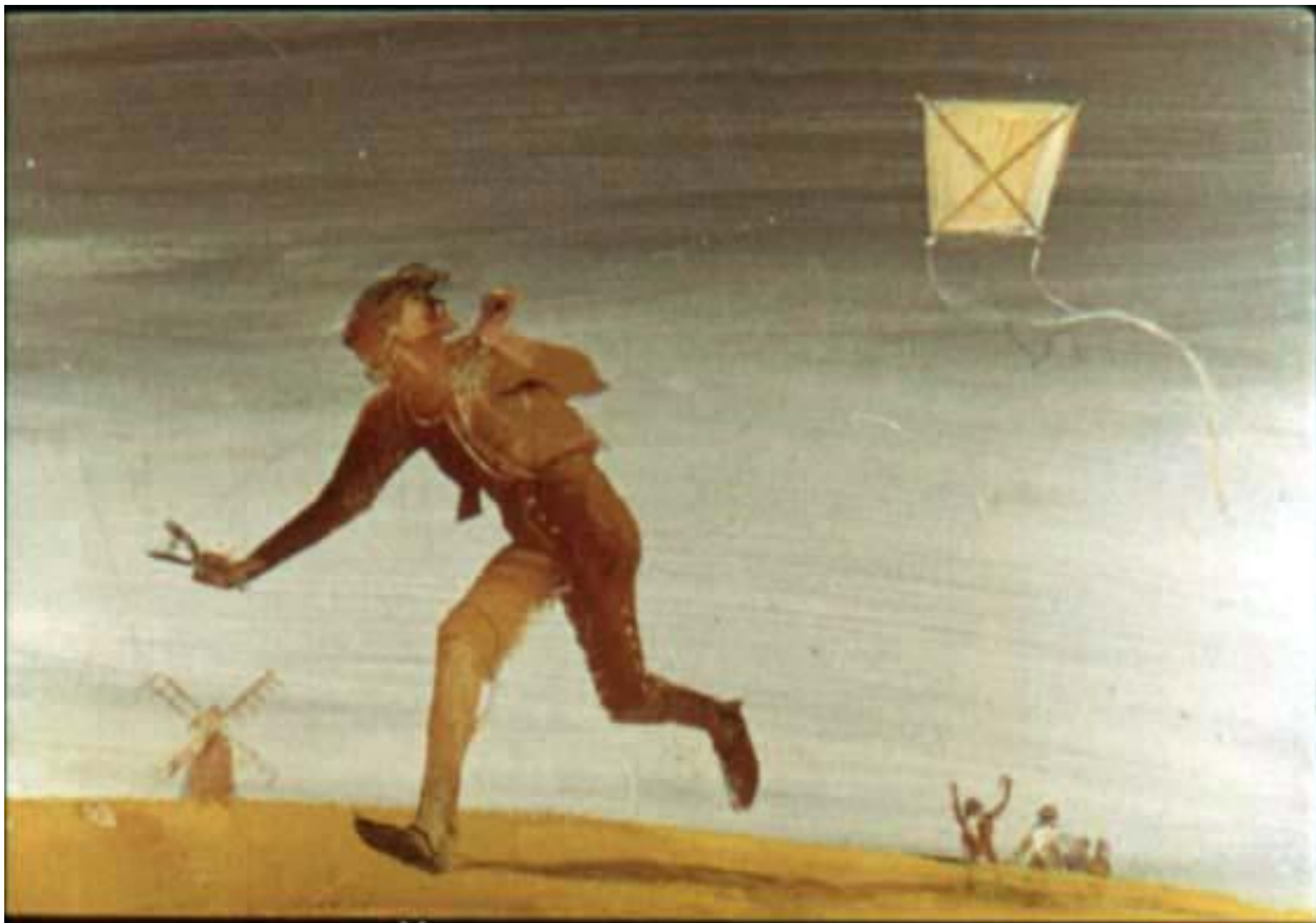
Учил запускать змея.