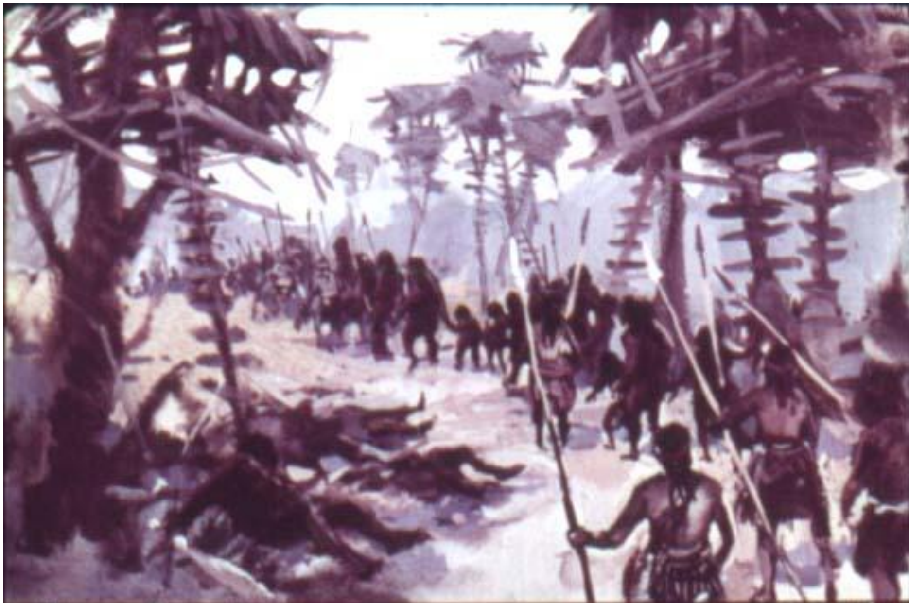
Город Дода (дода – так называли туземцы человекообезьян) был разрушен. Самки и детёныши взяты в плен.