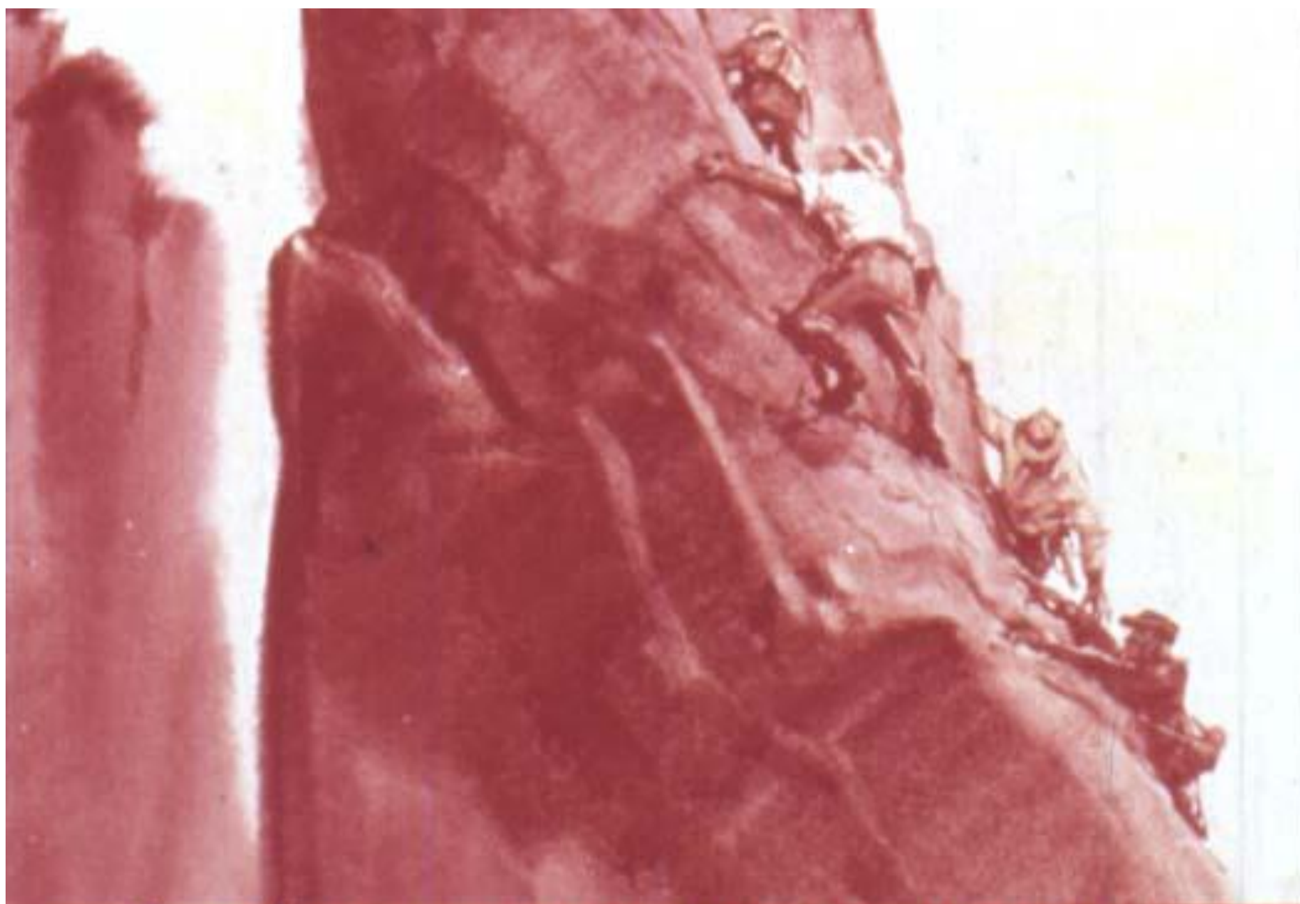
Утром Челленджер заставил всех подняться на утёс. [22]