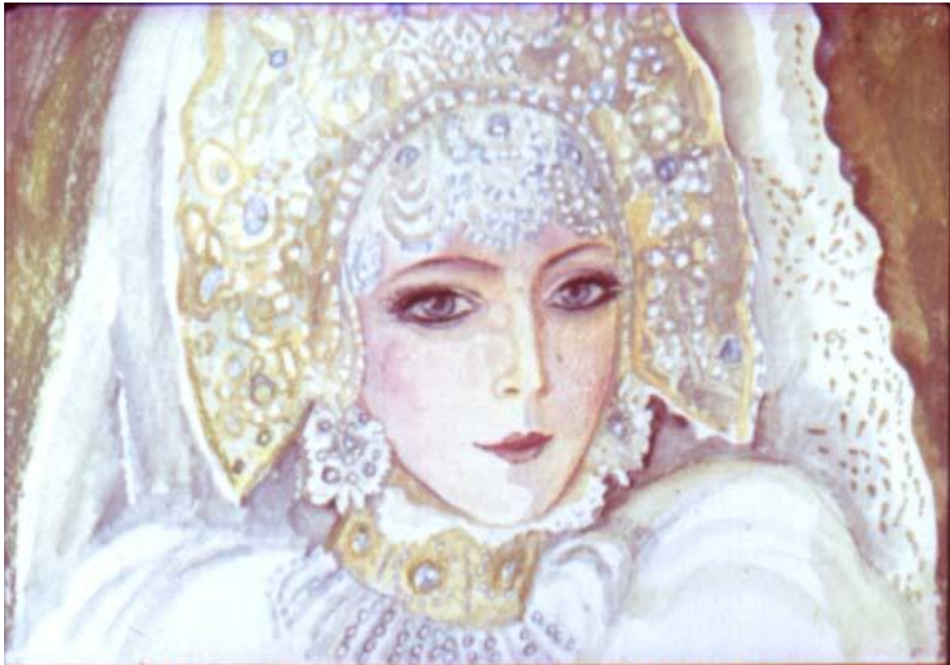
Ожила Алёнушка и стала краше прежнего.