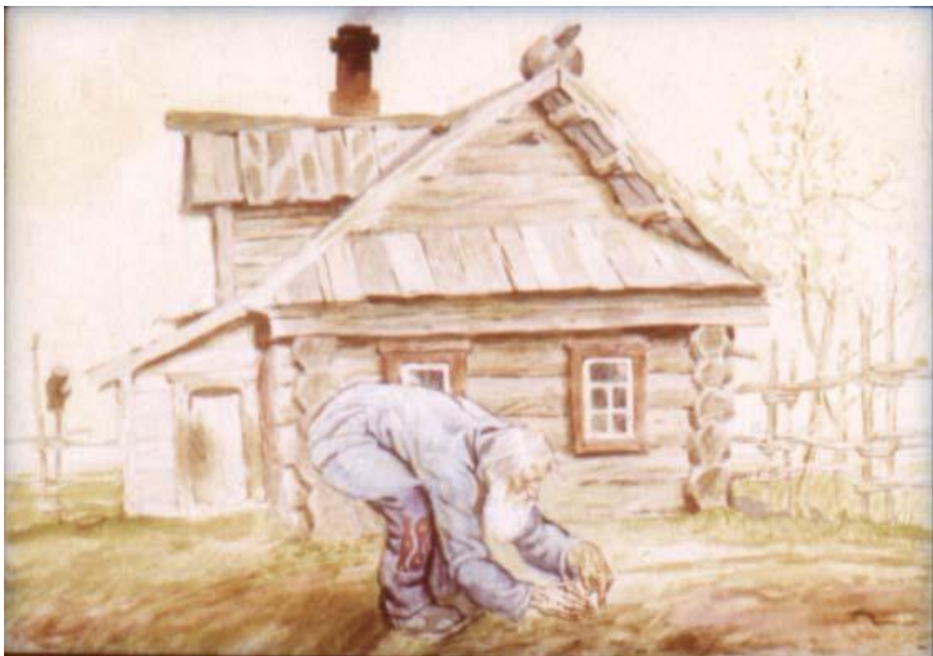
Посадил дед репку.