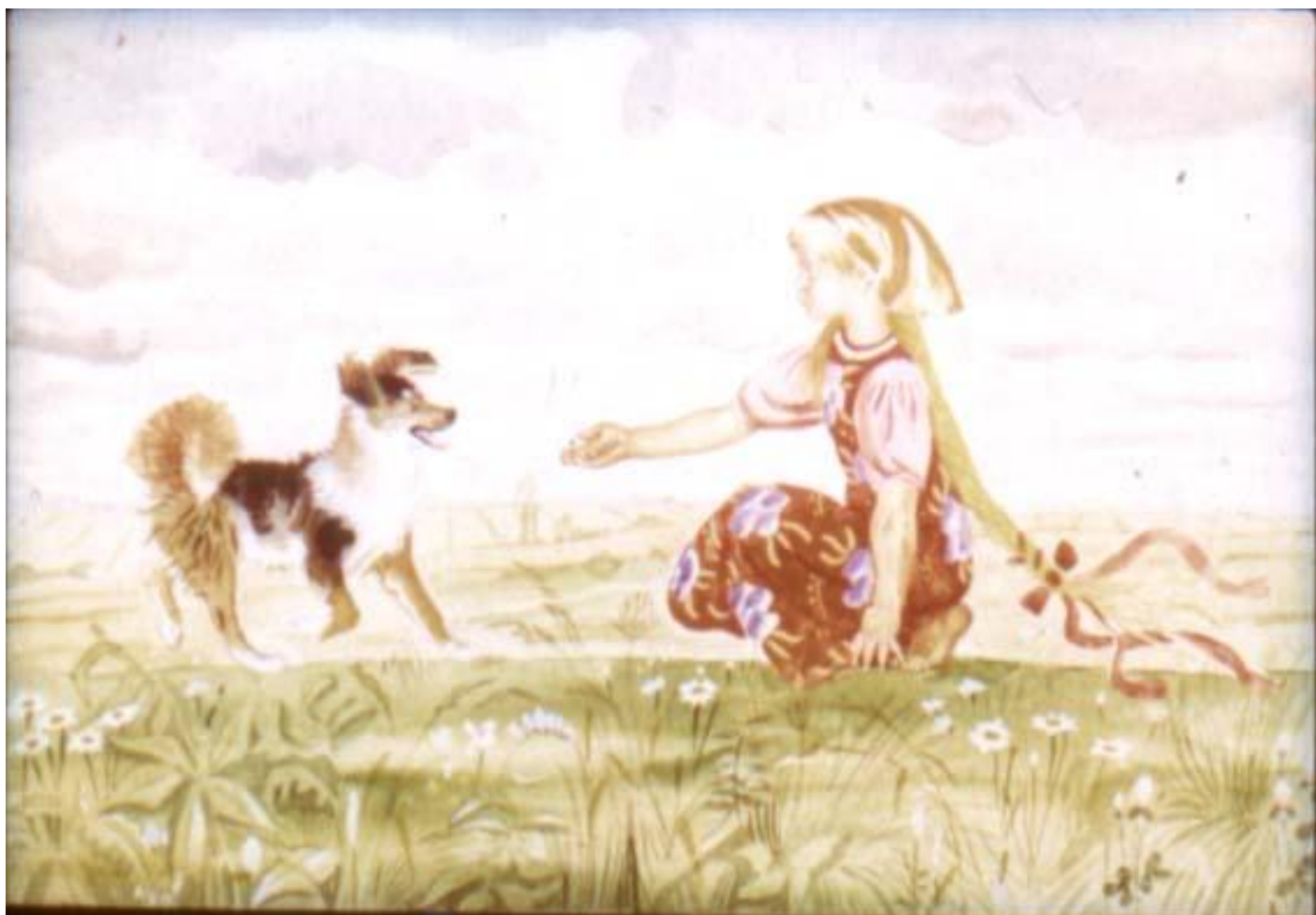
Позвала внучка Жучку.