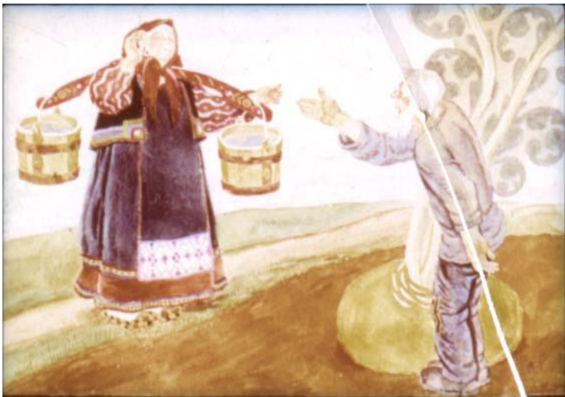
Позвал дед бабку.