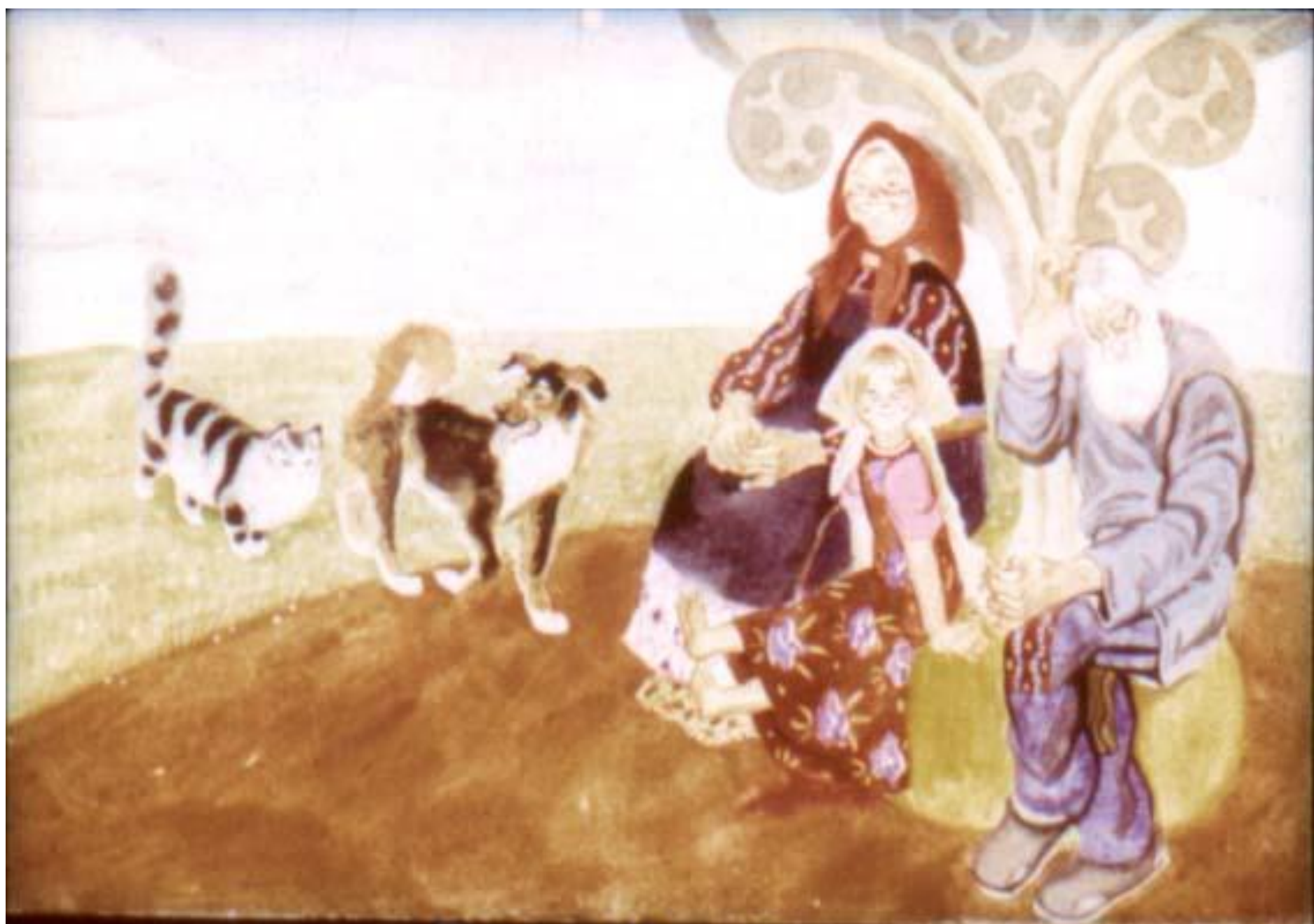
Позвала Жучка кошку.