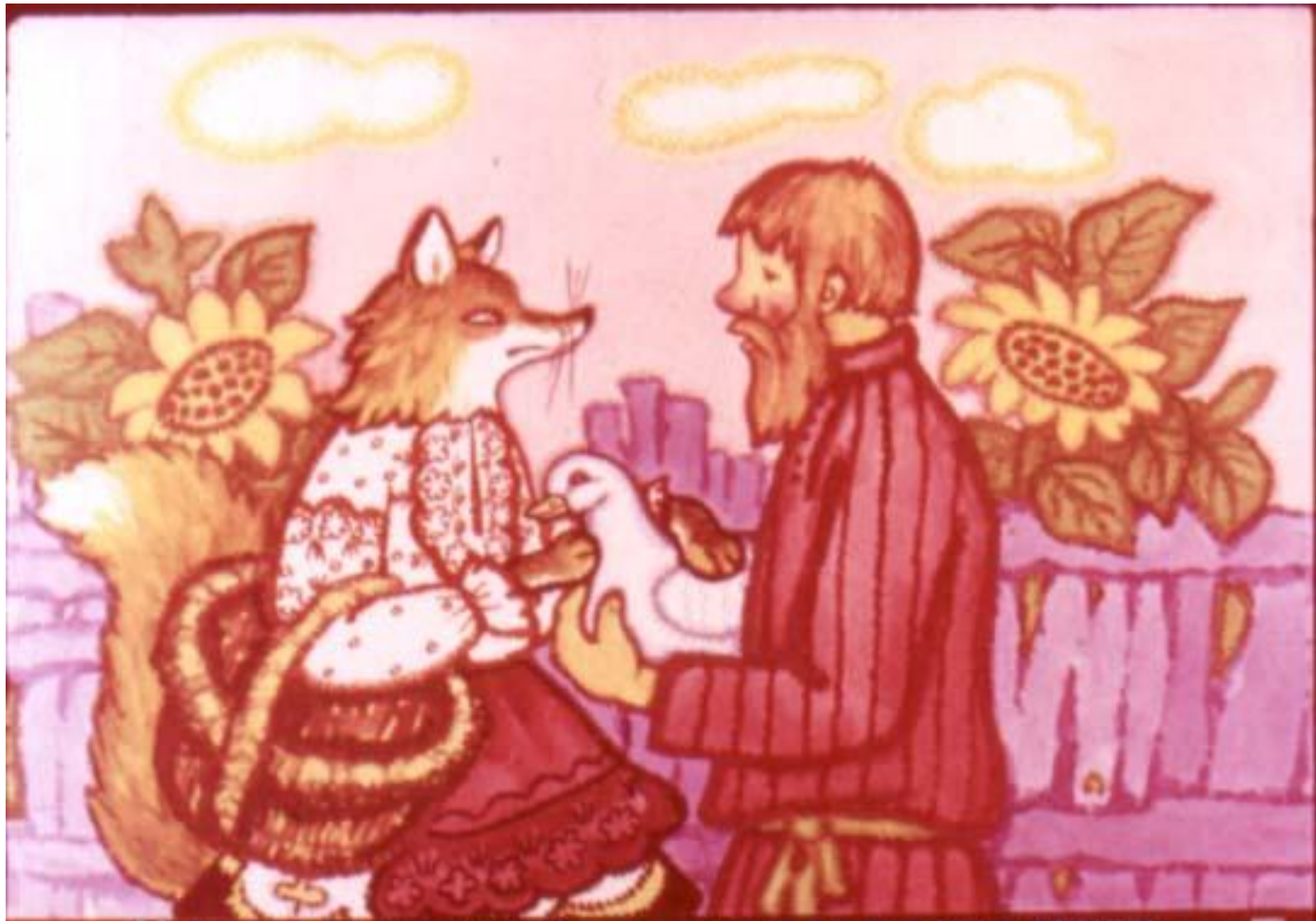
Мужик — делать нечего — отдал ей за курочку уточку.