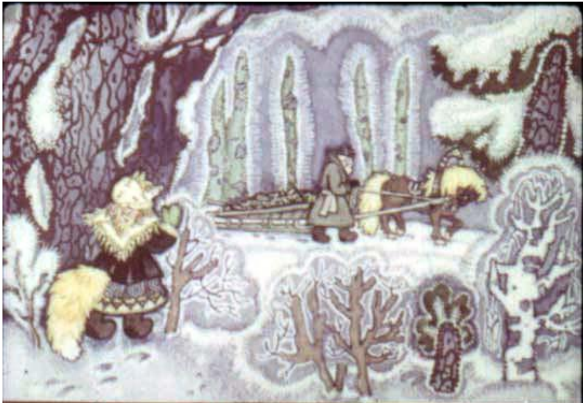
Видит – везёт мужик на санях мёрзлую рыбу.