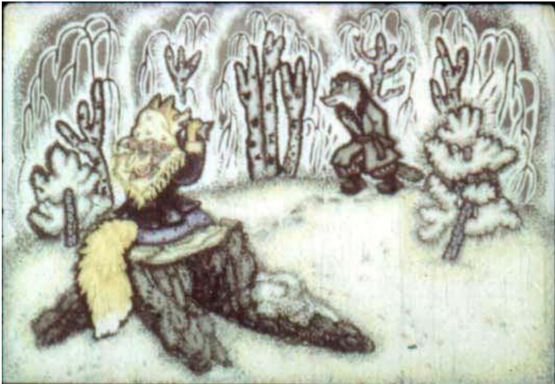
Видит лиса – бежит волк. От голода у него бока подвело. [14]