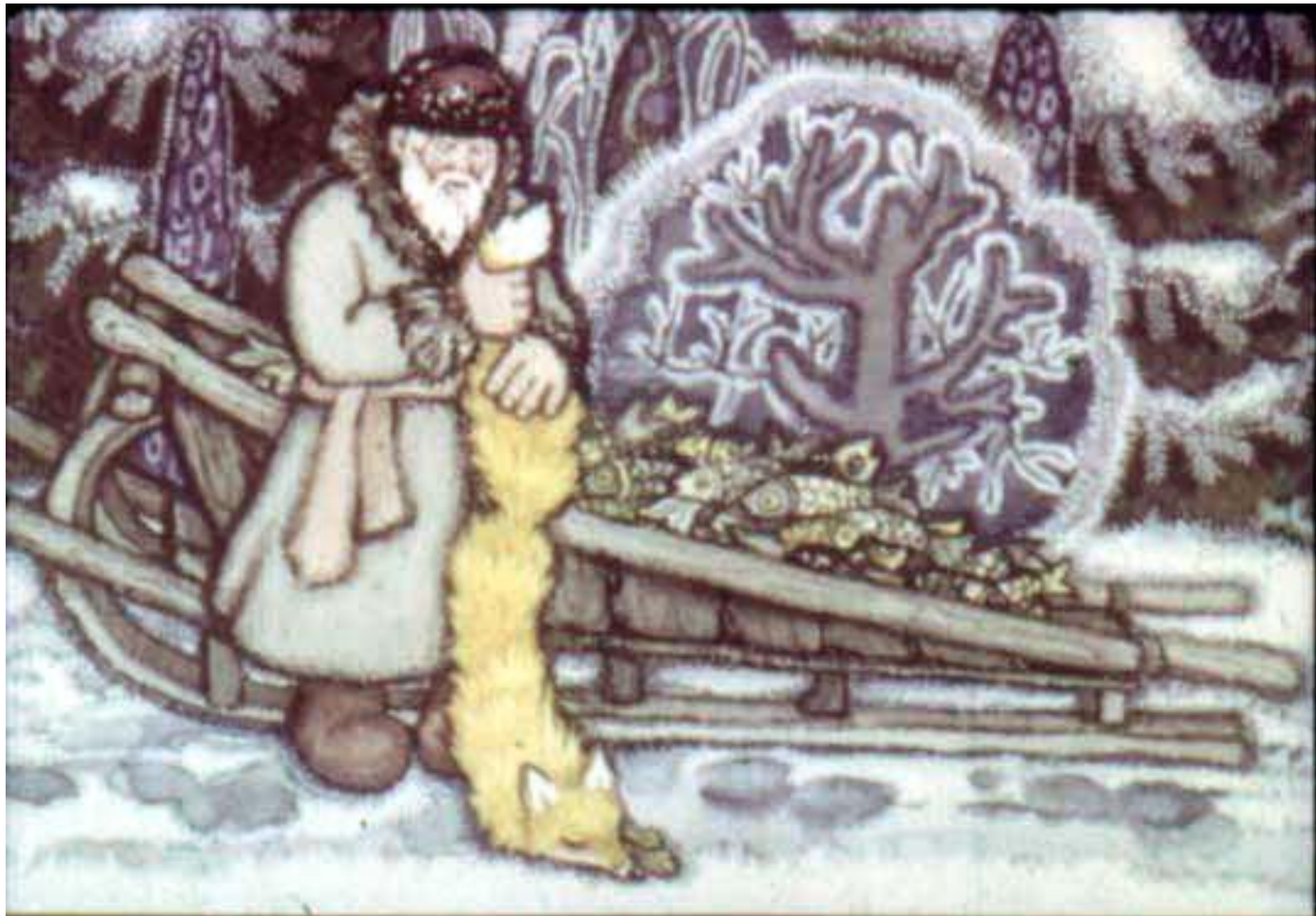
Взял мушник лису за хвост и швырнул в сани.