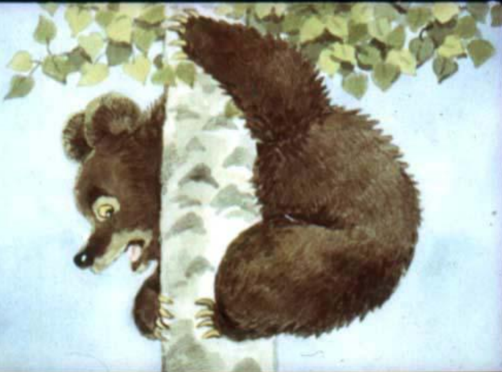
Медведь на берёзу залез—сверху-то ему получше видно. [29]