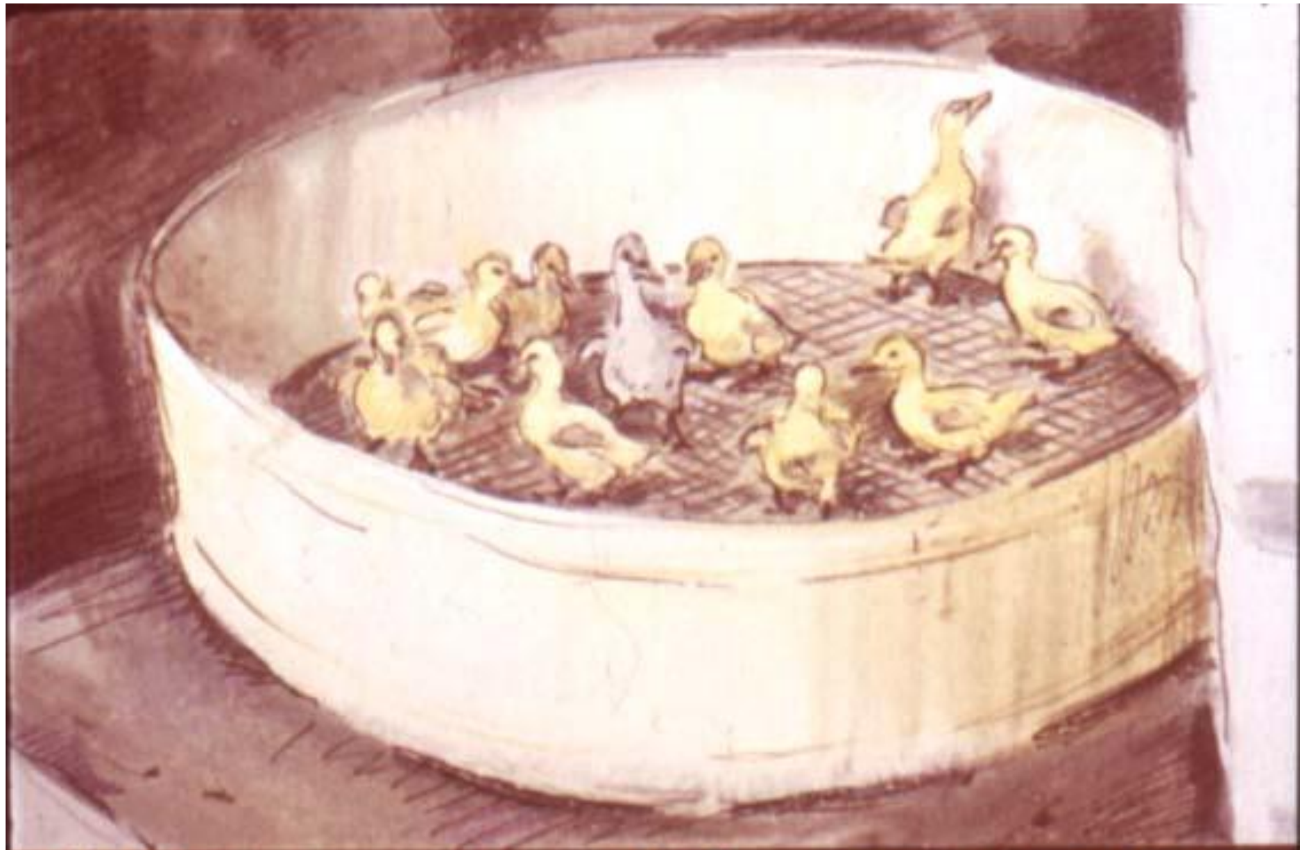
Через два дня в этом сите было уже одиннадцать маленьких гусят.