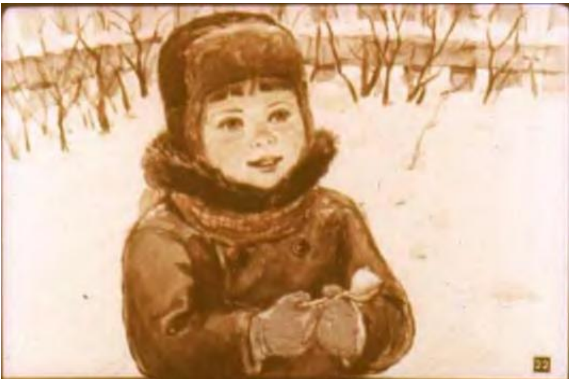
Брат их, маленький Олег, Чайной ложной носит снег.