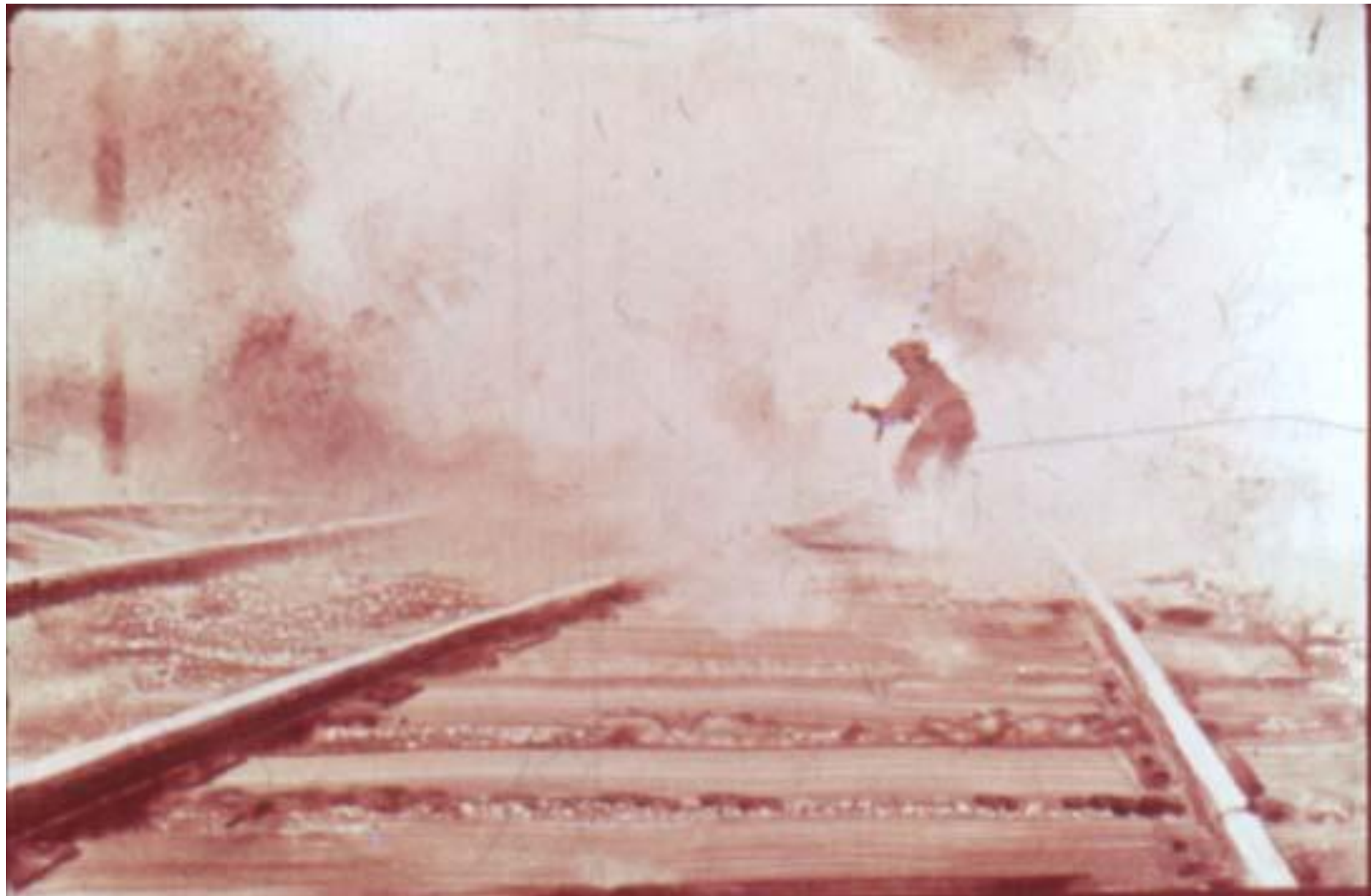
С автоматом в руках Петя бежал вдоль железнодорожного полотна...