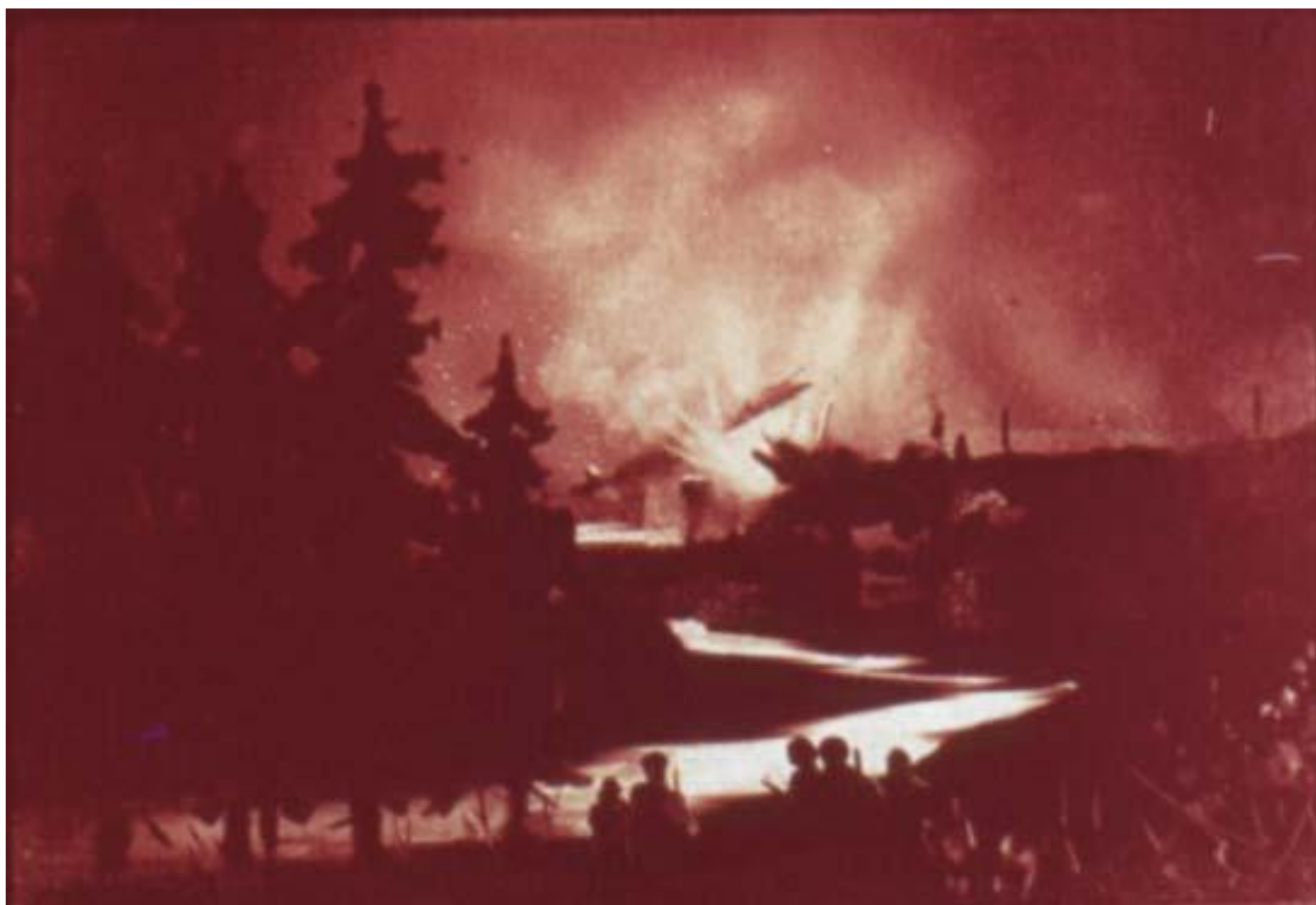
Ночью партизаны взорвали мост.