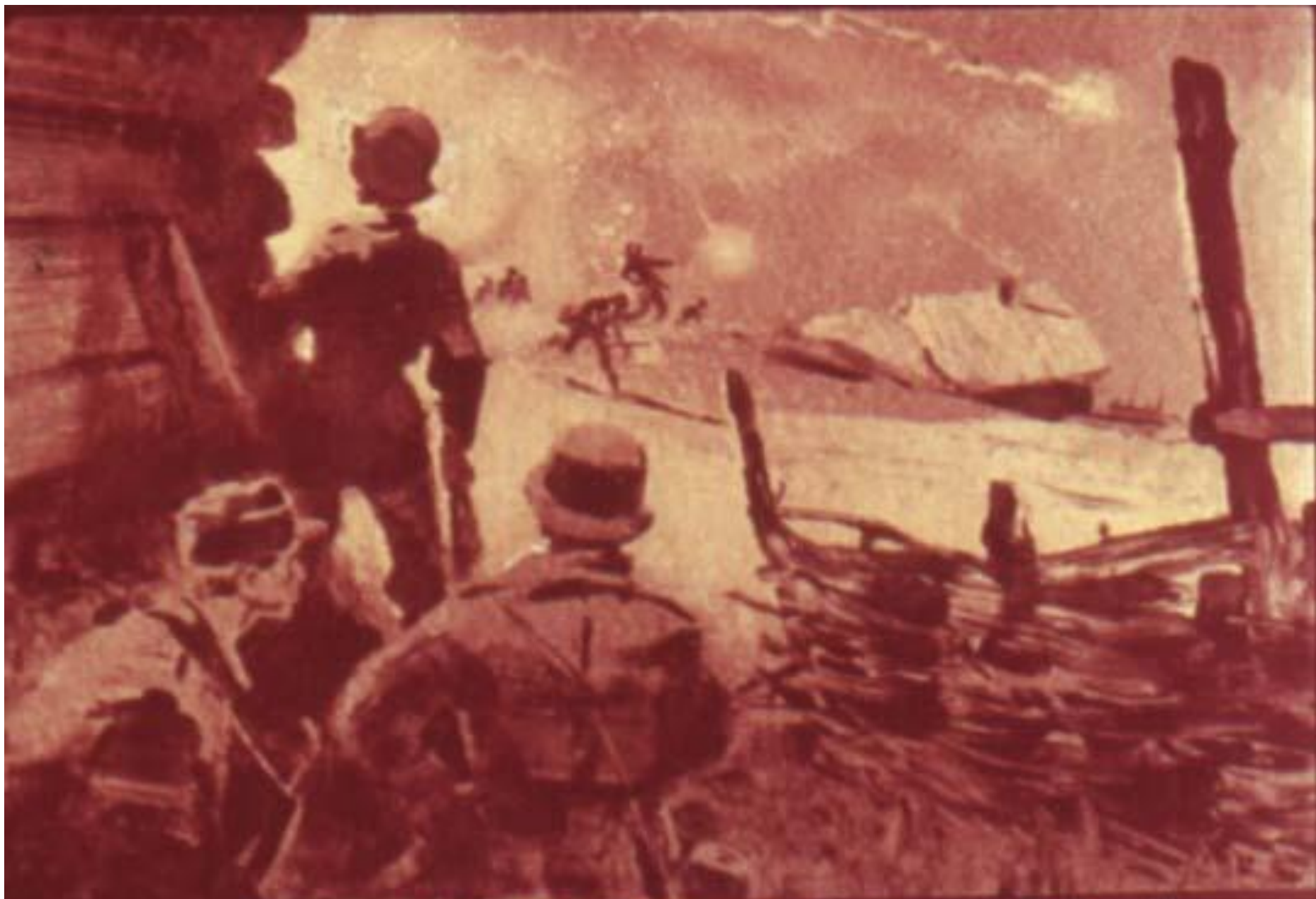
горел ли вражеский склад с боеприпасами.