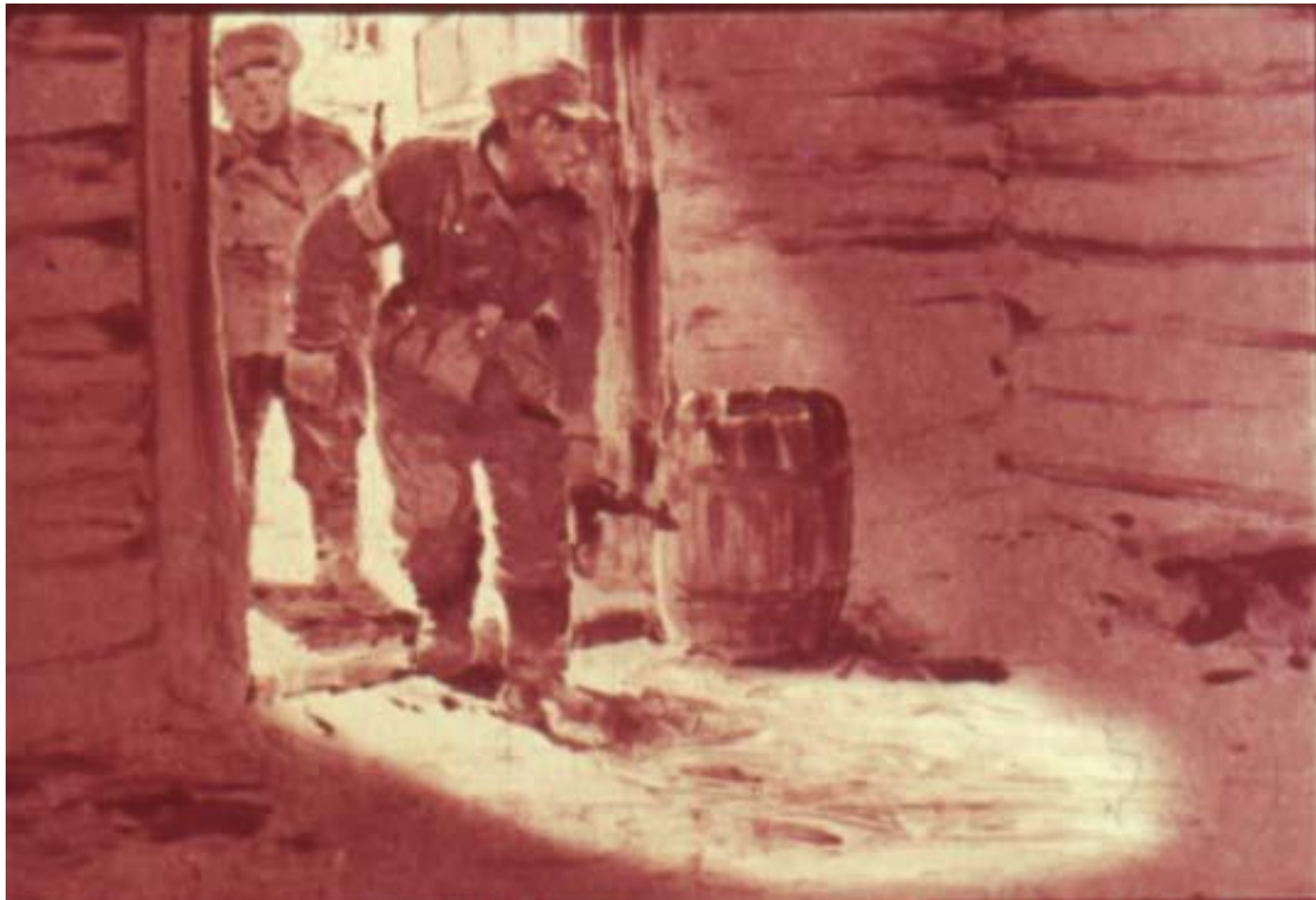
Когда полицаи пришли за пленником, в сарае никого не было.