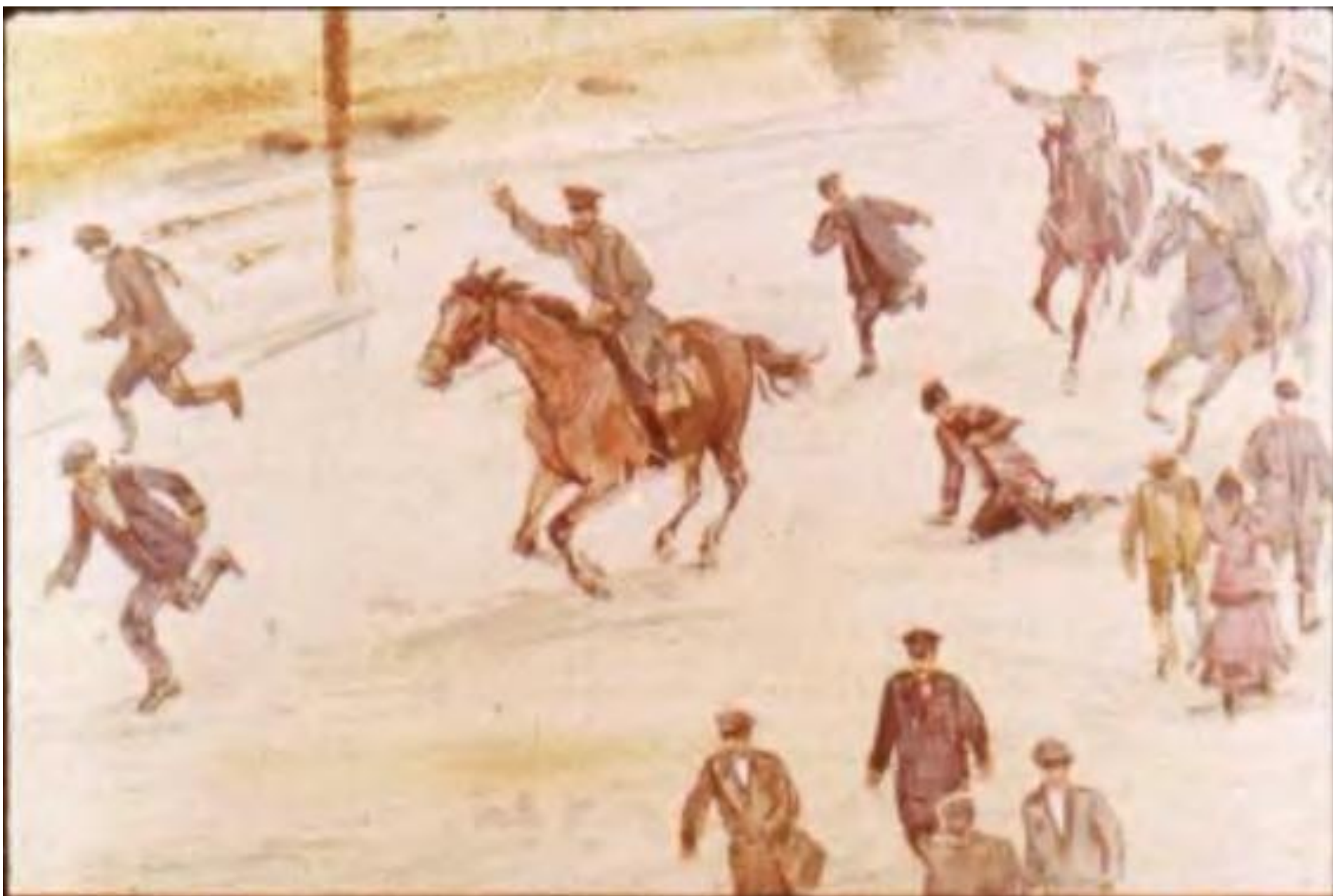
Остатки рассеянных демонстраций бежали врассыпную. Казаки настигали людей и рубили поодиночке.