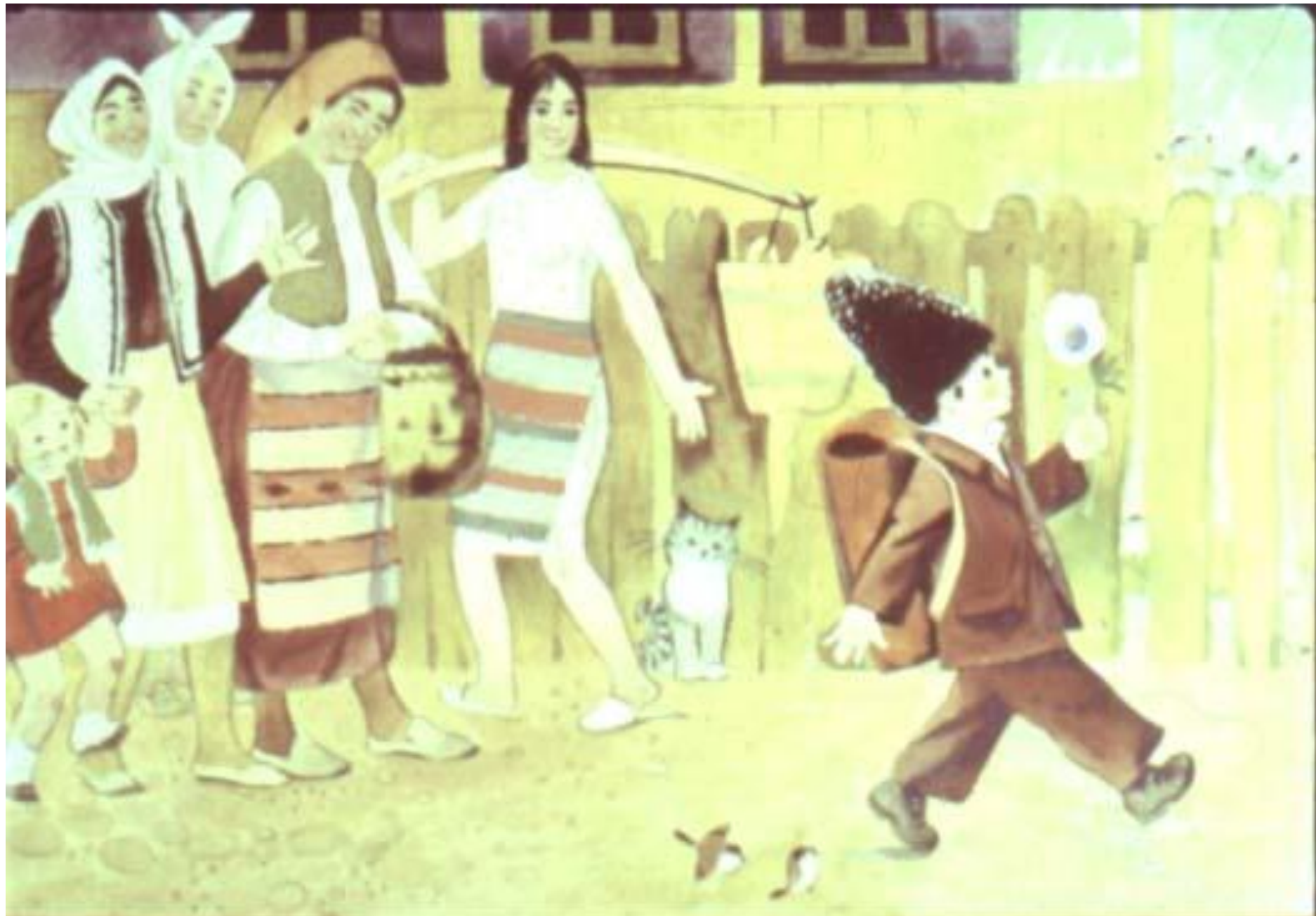
сорвал цветок в саду, ранец за плечи — и в школу.