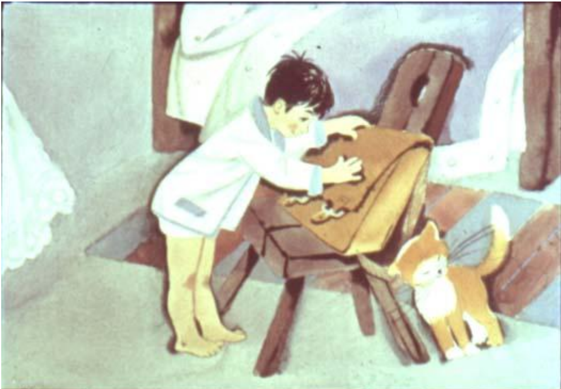
Утром Гугуцэ проснулся и обрадовался. Ранец был на месте. 10