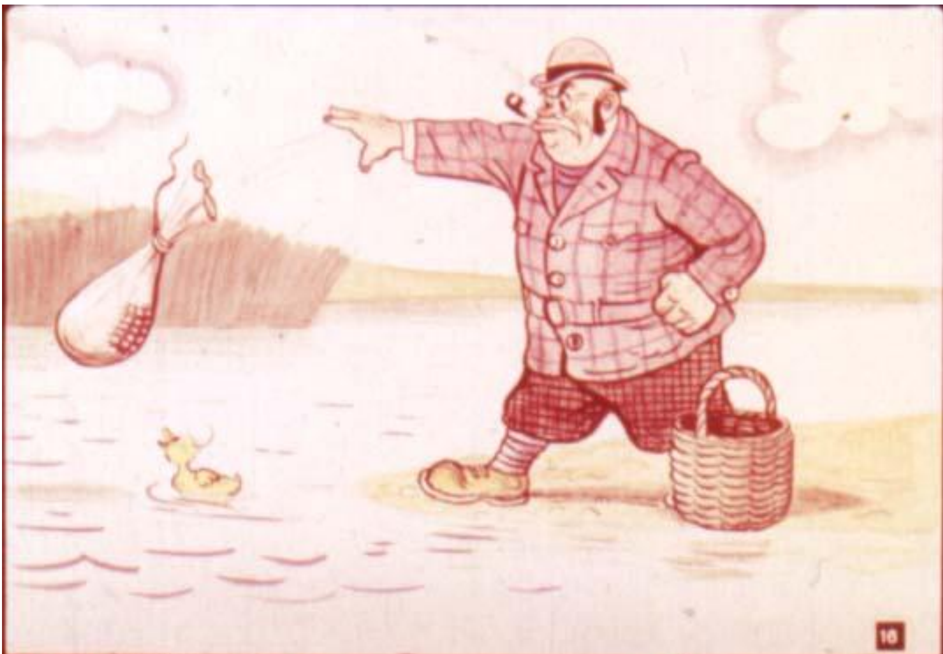
Человек вынул из корзинки мешок и – бух его в воду!