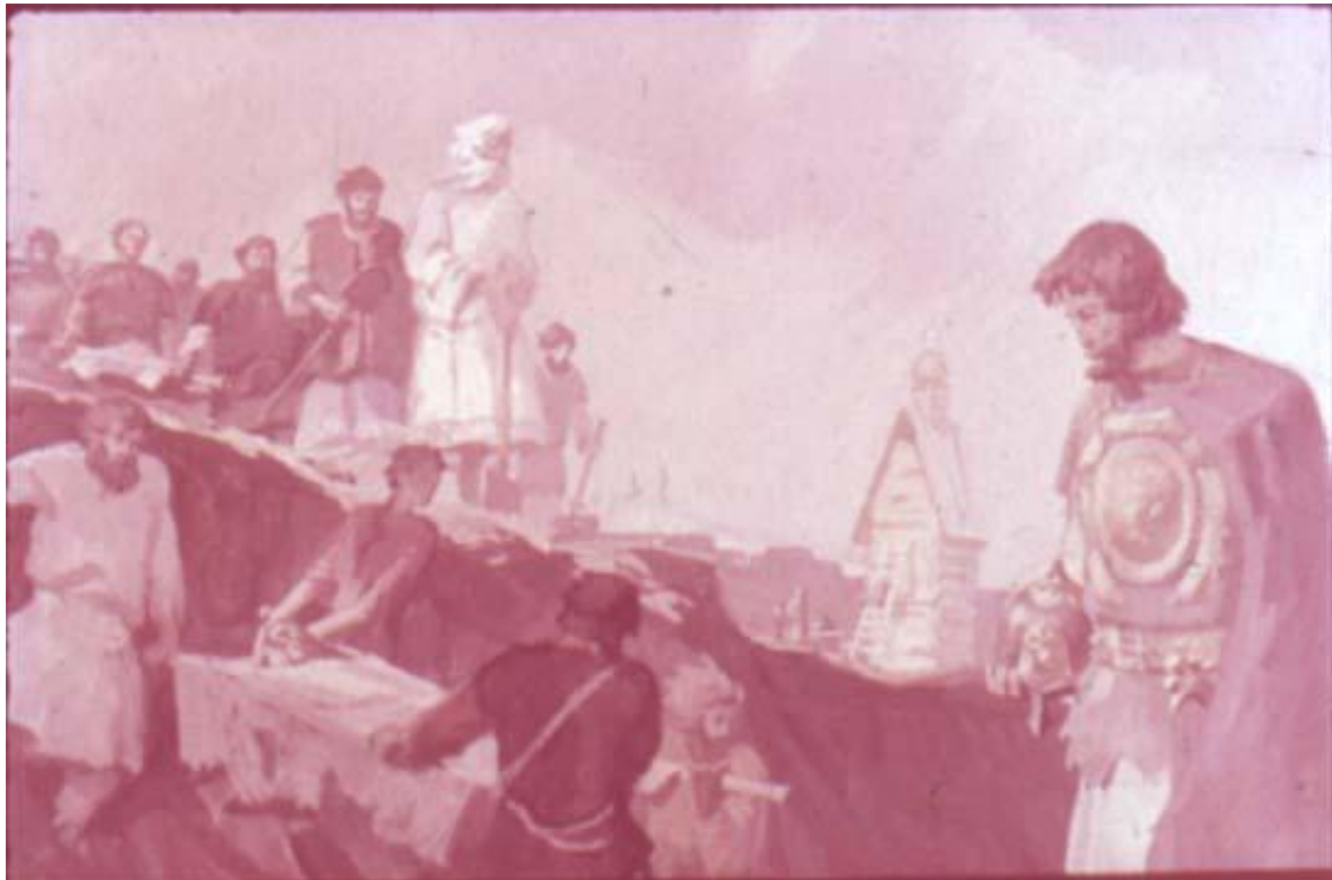
Восемь дней оставшиеся в живых русские воины «стояли на костях» и хоронили павших в битве соратников.