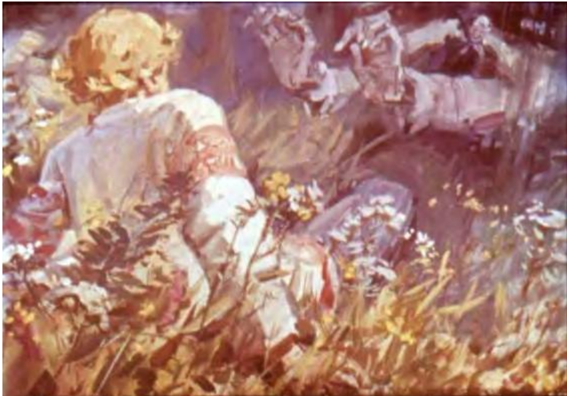
Хотел Илья подальше отползти, да силы вовсе не стало. [17]