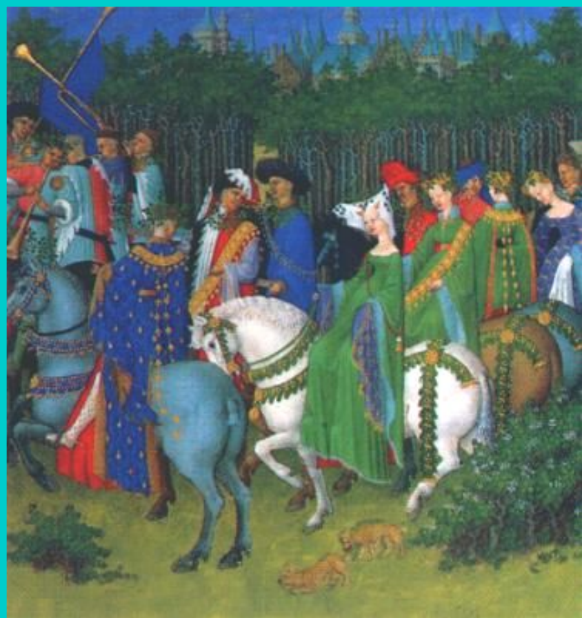
Плоды победы. Средневековая миниатюра.

Король ввел большие налоги на горожан и крестьян, зато прекратились набеги феодалов. Быстро развивалась торговля.