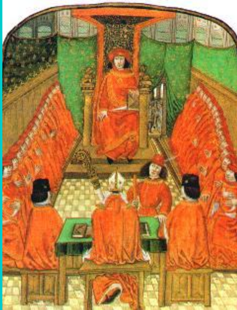
Орден «Золотого руна» бургундских герцогов.

Борьба короля и Карла продолжалась 12 лет. Король проиграл и заключил позорный мир.