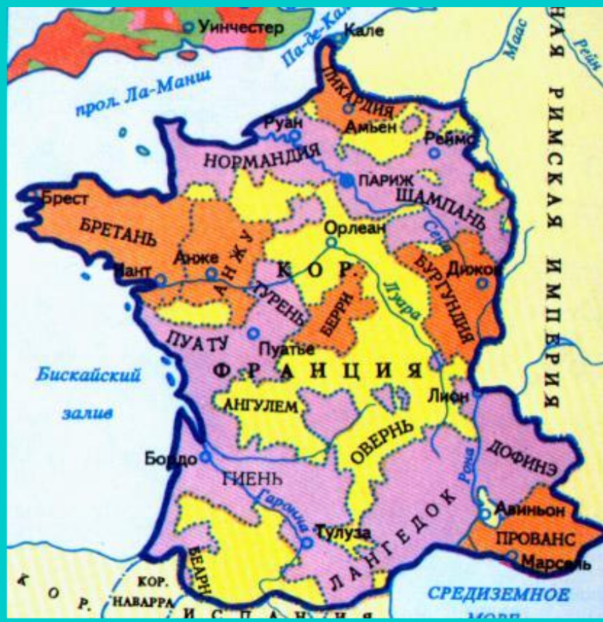
Франция в к.15 в.

Объединение страны привело к усилению королевской власти.