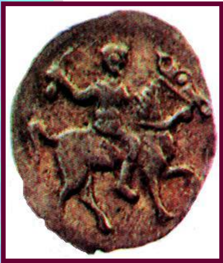
Копейка 1547 г.

Рост объема торговли требовал изменений в системе денежно-го обращения. В стране не ходило большое количество фальшивых денег и существовало 2 денежных системы-новгородская и московская.