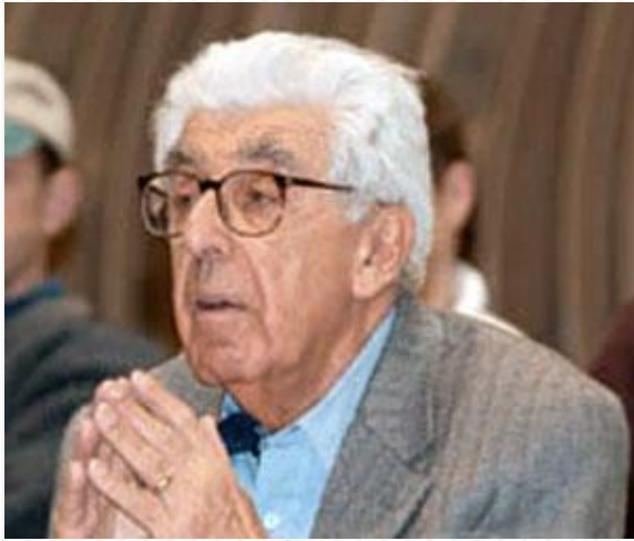
Барри Коммонер (1917) - американский эколог и биолог